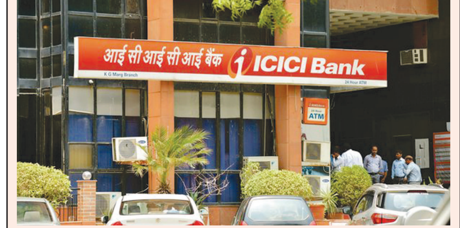
નવી દિલ્હી, તા. ૧૫ દેશની ખાનગી ક્ષેત્રની સૌથી મોટી બેંકો પૈકીની એક એવી આઈસીઆઈસીઆઈ બેંકે પોતાના ગ્રાહકોને આજે મોટો ફટકો આપી દીધો છે. બેંકે ઝીરો બેલેન્સ ખાતા ધારકોને ૧૬મી ઓક્ટોબરથી શાખાથી દરેક કેશ વિડ્રોઅલ માટે

આઈસીઆઈસીઆઈ બેંકે ગ્રાહકોને મોટો ફટકો આપ્યો : બેંકના ઝીરો બેલેન્સ ખાતા ધારકોને ૧૬મી ઓક્ટોબરથી શાખામાંથી દરેક રોકડ ઉપાડ માટે ચાર્જ ચુકવવાનો રહેશે : મશીનથી ડિપોઝિટ માટે ચાર્જ હશે