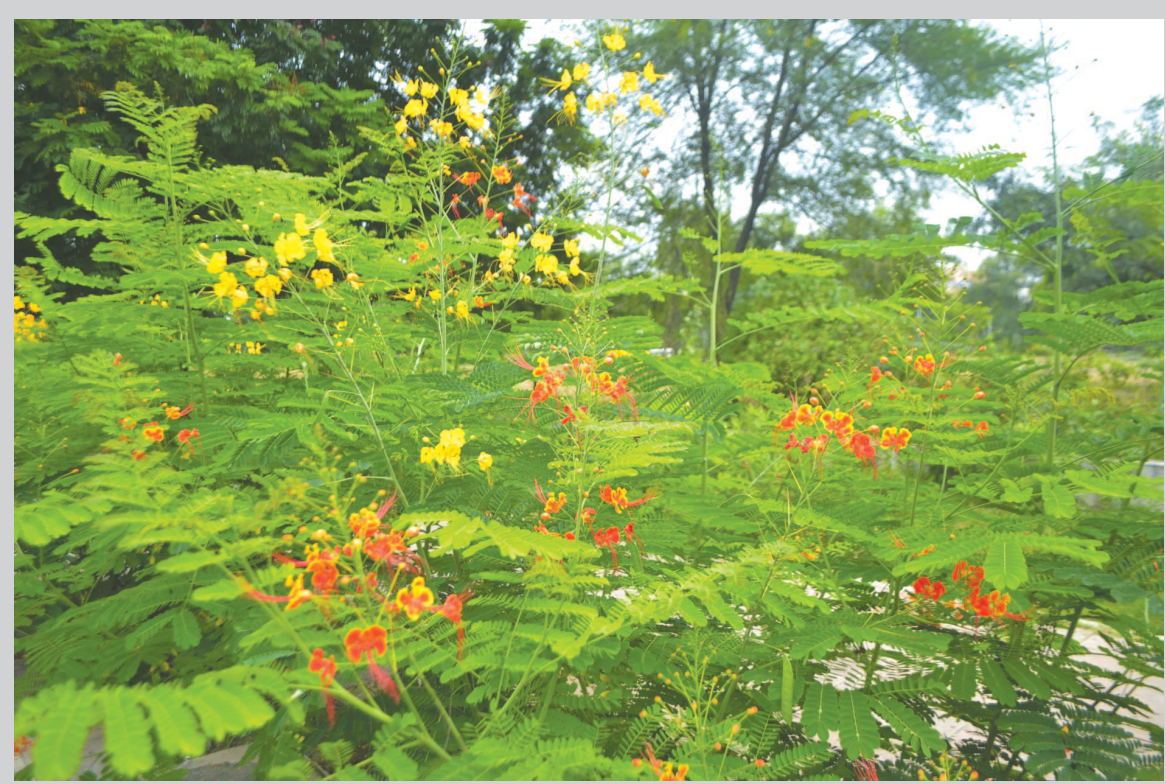
હિન્દી ફિલ્મ સંગીત સામાન્ય માણસના જીવનમાં ઘણું મહત્વ ધરાવતું જોવા મળે છે. જેમાં વર્ષો પહેલા એક ગીતકારે સુંદર શબ્દો લખ્યા હતા જે ગીત મૂલ લોકપ્રિય બન્યું હતું. જેના શબ્દો હતા 'દેખા મેંને દેખા હૈં યે એક સપના, ફૂલો કે શહેર મેં હો ઘર આપના.' ગાંધીનગરને પણ ફૂલોનું શહેર કરીએ તો એમાં જરાય અતિશયોક્તિ નથી કેમ કે અહીંની વનરાજી તથા બાગ બગીચામાં દરેક ઋતુમાં અલગ અલગ પ્રકારના વિવિધ રંગો અને આકાર ધરાવતા નયનરમ્ય પુષ્પો ખીલે છે. શહેરના સેન્ટ્રલ વિસ્તારમાં સ્વર્ણિમ પાર્ક નજીક ઉદ્યોગભવનથી એલઆઈસી બિલ્ડીંગ તરફ જવાના માર્ગે ખિલેલા આ સુંદર પુષ્પો નયનની સાથે સાથે મનને પણ અનેરો આનંદ આપે છે.

ગાંધીનગર તા ૧૯ શહેરમાં ટ્રાફિક નિયમનના મામલે વાહનચાલકો જાગૃત બન્યા છે. પીયુસી, હાઈસિક્યુરીટી નંબર પ્લેટ, લાયસન્સ, વીમા સહીતના નિયમોના અમલ માટે વાહનચાલકો સતત પ્રક્રીયામાં વ્યસ્ત જોવા મળી રહ્યા છે. પીયુસી સેન્ટરો પરથી અત્યાર સુધીમાં શહેર જિલ્લામાંથી અંદાજિત ૩૧ હજાર જેટલા વાહનોને પીયુસી આપવામાં આવ્યા છે. પરંતુ ટ્રાફિક નિયમનના મામલે આર ટી ઓ કચેરી જ નિરસતા સેવી રહી છે. હાલની સ્થિતિએ પણ અંદાજિત ૪ હજાર જેટલા વાહનોને નંબરો પડ્યા નથી. જેના લીધે આ વાહનચાલકોને ઠંડાવાનો વારો આવે છે. નવી ઠંડા નિતીના અમલ માટે ફેરફાર કરાયા બાદ પણ નિયત સમયમાં પણ આ વાહનોને અનુલક્ષી નંબરો પાડવાની પ્રક્રીયા પુર્ણ થાય તે અનિવાર્ય હોવાનો સુર ટ્રાફિક નિયમનના મામલે