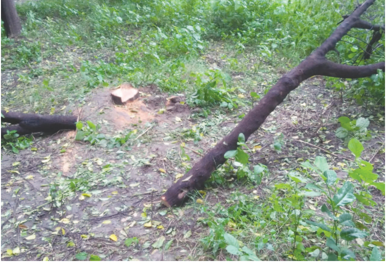
ખેતરમાં ખેડૂતે ૧૪૦ સફેદ ચંદનના છોડનું વાવેતર કરી છેલ્લા ૧૦ વર્ષથી ભારે માવજત ત્રાટકી ૭ ચંદનના ઝાડ કાપી અને ૧૫ ઝાડ પર ઘા મારી રહ્યુંકર થઈ જતા ભારે ચકચાર મચી

બાયડ, તા. ૨૧ પછી ઝાડના રૂપમાં તૈયાર થયા છે. ખેતરમાં બાયડ શહેરના ગાબટ રોડ પર આવેલા ઉભા ચંદનના ઝાડ જોઈ ચંદનચોર ટોળકી