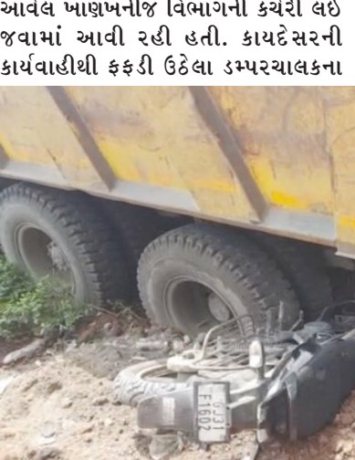
ગ્રાઈવરે તિરૂપતિરાજ વીલા બંગ્લોડ પાસે ચાલુ ડમ્પરે ફૂદકો મારી નાસી છૂટતા ડમ્પર રોડ પરથી ઉતરી નજીકમાં નિર્માણ થઈ રહેલા કોમ્પ્લેક્ષ પાસે ફંટાયું હતું અને બાઈક અને વીજપોલ સાથે અથડાતા કડુચાલો વળી ગયો હતો. સદનસીબે ડમ્પર વીજપોલ સાથે અથડાઈ ઉભું રહી જતા ડમ્પરમાં સવાર બે સિક્યુરિટી ગાર્ડનો