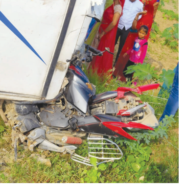
અકસ્માતે મોતનો ગુનો નોંધી વધુ તપાસ હાથ ધરી છે. ઉલ્લેખનીય છે કે હમણાં જ સરકાર દ્વારા ટ્રાફિકના નિયમો કડક બનાવવામાં આવ્યા છે પરંતુ બાઈક સવાર ત્રણેય માંથી એક પણ યુવક હેલ્મેટ પહેર્યું ન હતું. જો હેલ્મેટ પહેર્યું હોત તો કદાચ તેમનો આબાદ બચાવ થઈ ગયો હોત તો સ્થાનિક લોકોનું માનવું છે.

બનાસકાંઠા ના લાખણી નજીક બાઈક અને લકઝરી બસ વચ્ચે અકસ્માત સર્જતા ત્રણ લોકો ના કમકમાટી ભયાં મોત નિપજતા અરેરાટી મચી જવા પામી છે તો બીજી તરફ બસ નો ચાલક બસ મૂકી ફરાર થઈ ગયો છે. બનાસકાંઠામાં લાખણી ગામ પાસે સર્જાયેલા ગમખ્વાર અકસ્માતમાં બાઈક સવાર ત્રણ યુવકોનાં ઘટનાસ્થળે જ કરુણ મોત થયા હોવાની ઘટના સામે આવી છે. જેમાં લાલપુર ગામમાં રહેતા પ્રજાપતિ સમાજના ત્રણ યુવાન ભાઈઓ પોતાના બાઈક લઈને ગેળા થી લાખણી તરફ આવી રહ્યા હતા તે દરમિયાન સામેથી આવી રહેલ લકઝરી બસના ડ્રાઈવરે ગડલત ભરી ડ્રાઈવિંગ કરી બાઈક ને અડફેટે લેતા અકસ્માત સર્જાયો હતો. અકસ્માતમાં બાઈક પરથી પડકાયેલા ત્રણેય ભાઈઓ ગંભીર ઈજા પહોંચતા ઘટના સ્થળે જ કરુણ મોત નિપજ્યા હતા. આ બનાવની જાણ થતાં જ આજુબાજુના લોકો ઘટનાસ્થળે દોડી આવ્યા હતા. બનાવને પગલે ૬૦૮ એમ્બ્યુલન્સ વાન અને આગથલા પોલીસ પણ ઘટના સ્થળે આવી મુનકનો લાશને પીએમ અર્થે રેફરલ હોસ્પિટલ ખાતે ખસેડી હતી