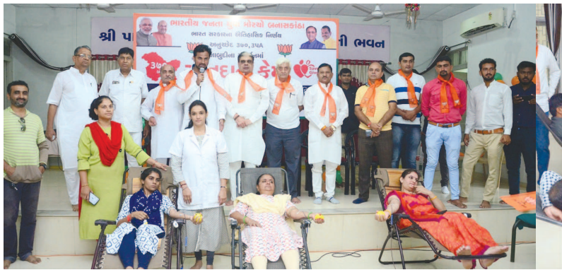
બનાસકાંઠા જિલ્લા યુવા ભાજપ દ્વારા આયોજિત રક્તદાન કેમ્પમાં ૩૭૦ના લક્ષ્યાંક સામે ૪૦૫ બોટલ રક્ત એકત્રિત થયું