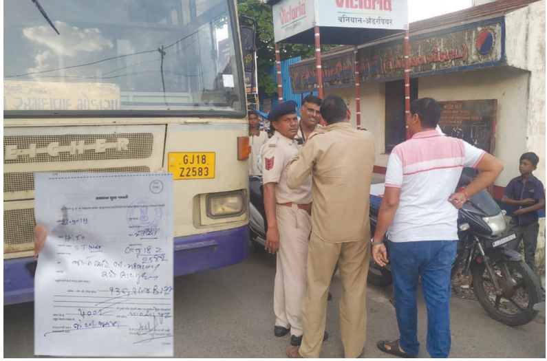
ટ્રાફિક વ્હીકલ એક્ટને લઈને ભારે વિરોધ જોવા મળી રહ્યો છે. રાજ્ય સરકારે ૧૫

મોડાસા, તા. ૨૨ કેન્દ્ર સરકાર દ્વારા અમલી બનાવાયેલ નવા મોટર વ્હીકલ એક્ટને લઈ પ્રજામાં મીશ્ર પ્રત્યાઘાતો પડી રહ્યા છે. ગુજરાતમાં પણ નવા