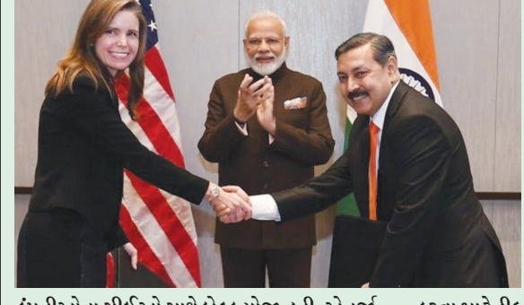
કંપનીઓના સીઈઓ સાથે બેઠક યોજી હતી. એનજી સેક્ટરમાં ટોપ સીઈઓ સાથે બેઠકમાં જુદા જુદા પાસા પર ચર્ચા કરવામાં આવી હતી. ઉર્જાના ક્ષેત્રમાં ભારત અને અમેરિકા વચ્ચે સહકારને વિસ્તરણ આપવાના ઉદ્દેશ્યથી આ બેઠક યોજાઈ હતી. બેઠક બાદ ભારતીય કંપની પેટ્રોનેટ અને અમેરિકાની કંપની ટેલ્યુરિયન વચ્ચે મહત્વપૂર્ણ સમજૂતિ થઈ હતી. મોદીએ સમાહના અમેરિકાના ઐતિહાસિક પ્રવાસ ઉપર છે જેમાં તેઓ જુદા જુદા મહત્વના કાર્યક્રમોમાં ભાગ લઈ રહ્યા છે. ટેલ્યુરિયન અને પેટ્રોનેટ એલએનજી લિમિટેડ વચ્ચે એમઓયુ પર હસ્તાક્ષર કરવામાં આવ્યા છે જે હેઠળ પીએલએલ

ઉર્જા ક્ષેત્રના સીઈઓ સાથે મોદીની મિટિંગ : અમેરિકાના ઐતિહાસિક પ્રવાસમાં મોદી ચારેબાજુ છવાયા : સમજૂતિમાં પીએલએલ અમેરિકા પાસેથી વાર્ષિક ૫૦ લાખ ટન લિક્વિફાઇડ નેચરલ ગેસની આયાત કરવા ઇચ્છુક : માર્ચ ૨૦૨૦ સુધી સમજૂતિ અમલી