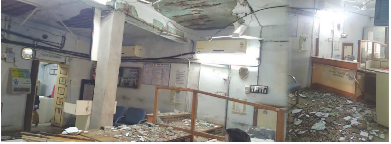
મલપુરના મેવડા ગામે આવેલ એસ.બી.આઈ. બ્રાન્ચના જર્જરિત મકાનની છતના પોપડા ખરી પડ્યા

કરવાનો વારો આવ્યો છે.નવિન બનાવેલ માર્ગ ઉપરથી કપચી પણ ઉખડવા લાગી છે ત્યારે બે નંબરીયા કોન્ટ્રાક્ટરે કામકાજ દરમ્યાન વેઠ ઉતારી હોઈ તેમ લોકમુખે ચર્ચાઈ રહ્યું છે. જલ્લા કક્ષાના વહીવટી તંત્રના જવાબદાર અધિકારીઓ ધ્વારા સત્વરે માર્ગનું સમારકામ હાથ ધરવામાં આવે તેવી લોકમંગણી છે.ટોરડા થી પાલ્લા સુધી બનાવેલ નવિન માર્ગ છ મહિનાની અંદર બિસ્માર હાલતમાં ફેરવાતા ઉચ્ચ કક્ષાના જવાબદાર અધિકારીઓ ધ્વારા સત્વરે ન્યાયિક તપાસ હાથ ધરવામાં આવે તો વ્યાપક ભ્રષ્ટાચાર બહાર આવી શકે તેમ લોકમુખે ચર્ચાઈ રહ્યું છે.