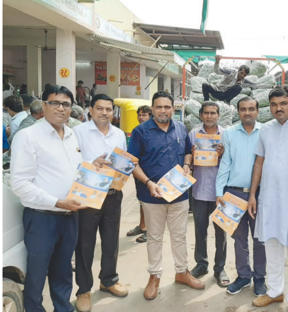
આલમપુર એપીએમસી સહ માર્કેટયાર્ડ ખાતે રાષ્ટ્રીય એકતા અભિયાન કાર્યક્રમ યોજાયો

ગાંધીનગર, તા. ૨૫ પાટનગરમાં વહેલી સવારે ઠંડીનો નજીવો ચમકારો લાગે છે, દિવસ દરમિયાન તાપમાન રહે છે. પરિણામે પંખા-એસી ચાલુ રહે છે. આમ બેવડી ઋતુના કારણે સ્વાસ્થ્ય ઉપર અસર થાય તે સ્વાભાવિક છે. અને તે કારણોસર દર્દીઓની સંખ્યામાં રોજબરોજ વધારો થાય છે. બિમારીનું નામ સાંભળતા જ કુટુંબીજનો ચિંતાતુર થાય છે. આજકાલ ઘરે ઘરે ડેન્ગ્યુની બિમારી ફેલાઈ છે ત્યારે આ સંજોગોમાં સ્વચ્છતા જળવાઈ રહે તે મૂળ જરૂરી છે. આવા દર્દીને આસપાસ પણ કોઈને જવા દેવા નહીં અને થોડી ઘણી સાવચેતી દર્દીના કુટુંબીજનોએ પણ રાખવા અખબારી યાદીમાં જણાવવાનું છે.