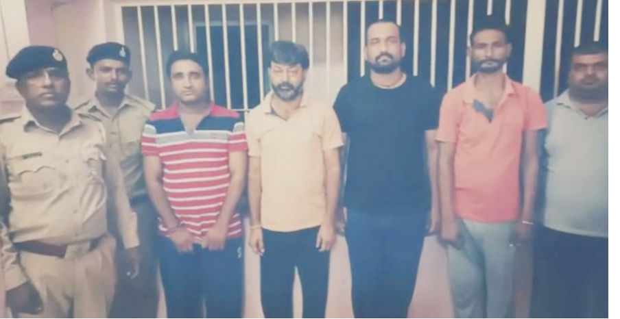
ભાટ ટોલટેક્ષ પાસે કોટેશ્વરના ખેડુત પર હુમલો કરનાર પાંચ શખ્સોની અટકાયત