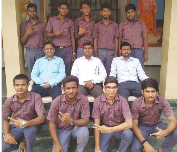
મગોડી પી.આર. ઠક્કર વિદ્યા વિહાર ખેલ મહાકુંભ-૨૦૧૯ રસ્સાખેંચ સ્પર્ધામાં પ્રથમ સ્થાને વિજેતા