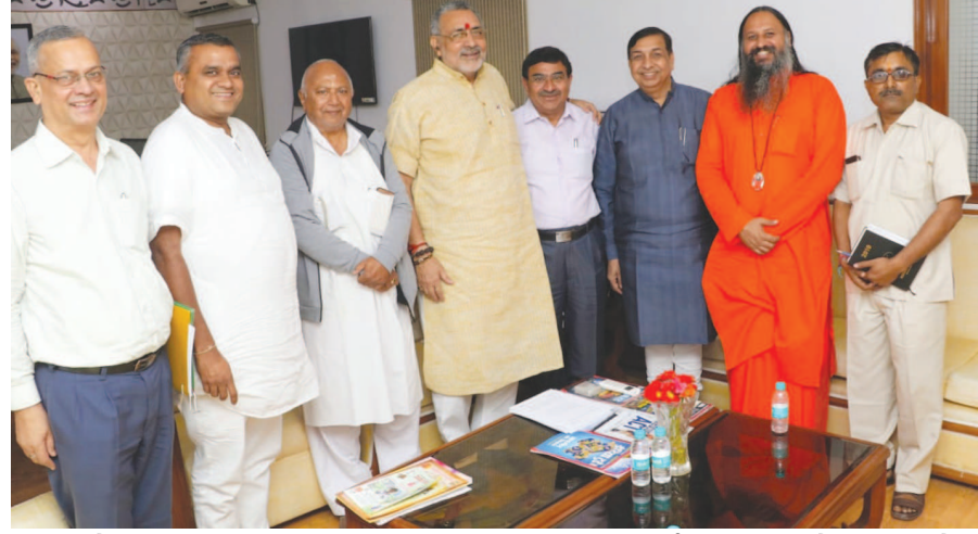
તાજેતરમાં ભારત સરકારના પશુપાલન મંત્રી દ્વારા બ્રાહ્મીલમાં સ્થાઈ ગીર સાંઠના એષ લાખ સીમેન્ટ ડિઝીટીની ભારતમાં યોજના બનાવવામાં આવી છે. આ યોજનાનો વિરોધ કરવા ડેલીવેશન દ્વારા દિલ્હી રૂબરૂ ગિરીરાજસિંહે રજૂઆત કરવામાં આવી હતી.