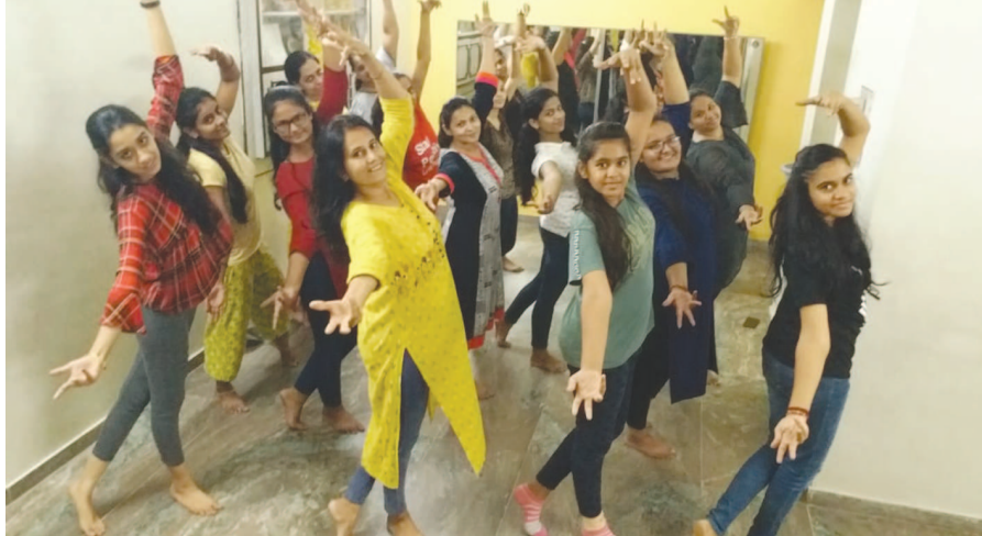
છેલ્લા ૨૧ વર્ષથી પૂજન ડાન્સ એકેડેમી દ્વારા નવરાત્રી નિમિત્તે રાસ ગરબા શીખવવામાં આવે છે. આ વર્ષે પણ નાનાથી લઈ મોટા કલાસીસમાં ગરબા શીખી ગરબે ધૂમવા ઉત્સાહિત જણાઈ રહ્યા છે.

સવારે ૮.૦૦ કલાકની સ્થિતિએ સરદાર સરોવર જળાશયમાં ૩,૨૯,૧૮૯.૪૮ એમ.સી.એફ.ટી. પાણીનો સંગ્રહ થયો છે. જે કુલ સંગ્રહશક્તિના ૯૮.૫૪ ટકા છે. ૬૨ જળાશયો ૭૦ થી ૧૦૦ ટકા તેમજ ૧૪ જળાશયો ૫૦ થી ૭૦ ટકા વચ્ચે ભરાયા છે તેમ, રાજ્યના જળ સંપત્તિ વિભાગ, ગાંધીનગર દ્વારા મળેલા અહેવાલોમાં જણાવાયું છે. ઉત્તર ગુજરાતના ૧૫ જળાશયોમાં ૬૧.૨૩ ટકા, મધ્ય ગુજરાતના ૧૭ જળાશયોમાં ૯૭.૬૧ ટકા, દક્ષિણ ગુજરાતના ૧૩ જળાશયોમાં ૯૭.૩૭ ટકા, કચ્છના ૨૦ જળાશયોમાં ૭૫.૫૯ ટકા અને સૌરાષ્ટ્રના ૧૩૯ જળાશયોમાં ૮૬.૮૦ ટકા પાણીના સંગ્રહ સાથે રાજ્યના કુલ ૨૦૪ જળાશયોમાં ૫,૦૫૭,૭૧૪.૩૩ એમ.સી.એફ.ટી. મીટર ઘનફૂટ એટલે કે ૯૦.૮૪ ટકા પાણીનો સંગ્રહ છે.