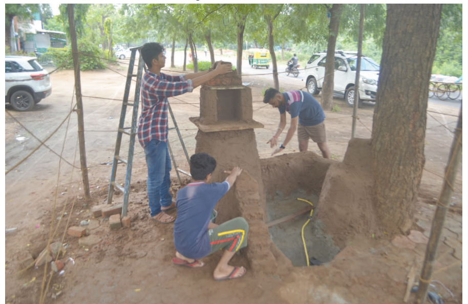
નવરાત્રી નજીક આવી રહી છે ત્યારે સે-૧૬ ખાતે બાળકો પરંપરા મુજબ માતાજીનો ગબ્બર બનાવતા ઉત્સાહિત જોવા મળી રહ્યા છે.

પાર : ભયજનક સપાટી નજીક સપ્ટેમ્બર મહિનો પૂર્ણ થવાને હવે થોડા જ દિવસો બાકી રહ્યા છે, છતાં આ વર્ષે સુરતના ઉકાઈ ડેમમાં સતત પાણીની આવક યાદુ રહેતા તંત્ર દ્વારા સતત પાણી છોડવાનું વધારી અને ઘટાડીને ઉકાઈ ડેમને સંપૂર્ણ ભરવા તરફ જઈ રહ્યા છે. આજે ઉકાઈ ડેમની સપાટી ૩૪૪.૦૮ પર પહોંચી ગઈ છે અને ભયજનક સપાટી ૩૪૫ ફૂટ હોવાથી હવે માત્ર એક જ ફૂટ પાણીની સપાટી ભયજનકલ લેવલથી બાકી રહી છે. તંત્ર દ્વારા ડેમમાં પાણીની આવક પર સતત