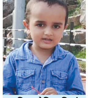
સુતરિયા મોક્ષિત નિશાંત