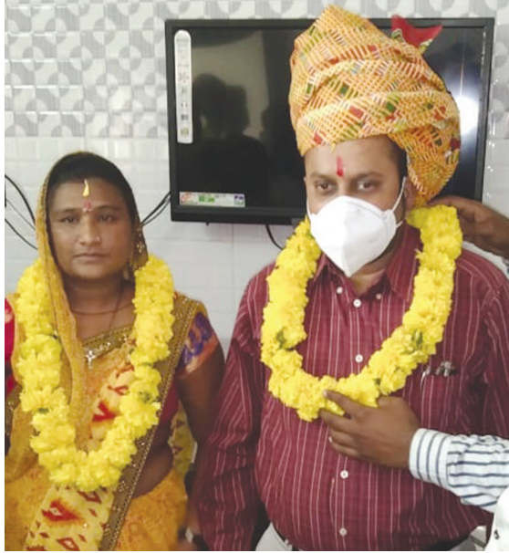
તલોદનગરમાં પાલિકાના હોદ્દાદારોનું ટેર ઠેર સન્માન સમારંભ યોજાયા હતા. જેમાં તલોદમાં

ઉભરાવવાના પ્રશ્નો તેમજ ટેર ઠેર ભરાયેલા બાબોચિયા દૂર કરવા સાથે પંચાયત વખતથી રહેઠાણના મકાનો સિધા નામે કરવા તેમજ વિજળી, પાણી સ્વચ્છતા અને વારંવાર રોગિસ્ટ વાતાવરણને જોતા દવા છંટકાવ સાથે આરૂંડ ધડ ગેરકાયદેસર જમીનો પર સરકારનો કબ્જો કરેલી જમીન ભુમાકિયાઓથી દૂર કરવા માંગ પણ કરાઈ હતી.