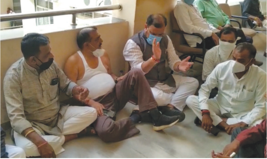
નાણાપંચના કામો અંગે અન્યાય થઈ રહ્યો છે. નક્કી