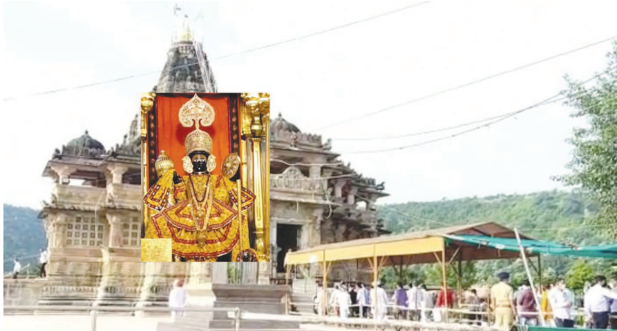
કોરોના ઈકેક્ટને લઈ બંધ રહેવા પામી છે. પ્રસિધ્ધ શક્તિપીઠ અંબાજી ખાતે ઈતિહાસથી પહેલીવાર ભાદરવી પૂનમે જ

કરી ધન્યતા અનુભવી હતી. મંદિર ટ્રસ્ટ દ્વારા સરકારીગૌઈ લાઈન અનુસાર શ્રદ્ધાળુઓ માટે સેનેટાઈઝર, માસ્કની સુવિધા ઉપલબ્ધ કરવાની સાથે સોશિયલ ડિસ્ટન્સીંગનું પાલન કરાવવા ભારે