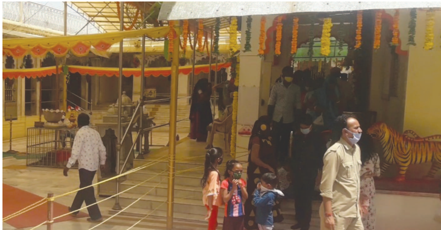
જહેમત આદરી હતી. ઈટાડી ખાતેના અંબાજી સા જગદંબાના પુનનકારી દર્શનનો હજારો માઈભક્તો લાભ લીધો હતો.