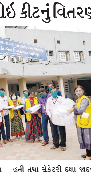
ગાંધીનગર, તા.૧૦ ગાંધીનગર જિલ્લામાં 'યજ્ઞદાન પખવાડીયા'ની ઉજવણીના ભાગરૂપે ગાંધીનગર જનરલ હોસ્પિટલ આયોજીત 'રાષ્ટ્રીય અંધત્વ અને દષ્ટિ ખામી