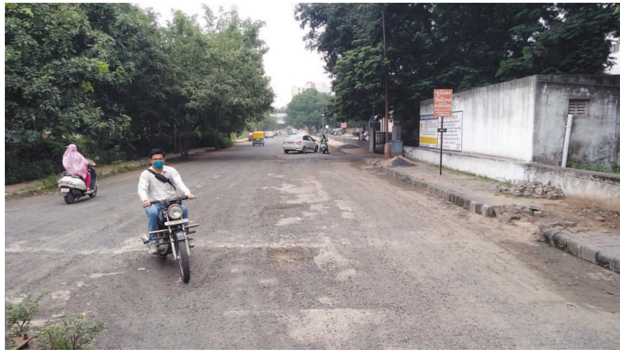
વરસાદે શહેરના માર્ગોની હાલત બગાડી નોંધી છે. ઠેર ઠેર ડામર ઉખરી ગયા છે તો ગાબડા પણ ઠેક ઠેકાણે પડ્યા છે. સિવિલ હોસ્પિટલના પાછળની તરફ મેડીકલ કોલેજ અને સ્ટાફ ક્વાર્ટર્સ તરફ જવાનો માર્ગ બિસ્માર બની ગયો છે જેના કારણે વાહનચાલકો અને રાહદારીઓ મુશ્કેલી અનુભવી રહ્યા છે.