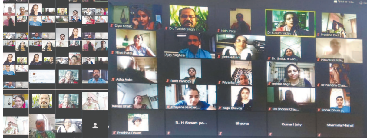
ગાંધીનગર, તા. ૧૧ કડી સર્વ વિશ્વવિદ્યાલય સંલગ્ન ફેકલ્ટી ઓફ એજ્યુકેશન