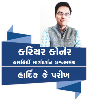
કરિયર કોનર કારકિર્દી માટેના પ્રશ્નોના હાર્દિક કે પરીખ

નમસ્કાર. "કરિયર કોનર" કોલમ ને વાચકમિત્રો તરફ થી ખૂબ જ સારો પ્રતિસાદ પ્રાપ્ત થઈ રહ્યો છે. વિદ્યાર્થીઓ, વાલીઓ અને દરેક વાચકમિત્રો ને કરિયર વિષે અને કરિયર ને લગતા વિવિધ વિકલ્પોની માહિતી આપવી એજ અમારો મુખ્ય ઉદ્દેશ્ય છે. આપના કરિયરને લગતી કોઈ પણ મૂંઝવણ હોય એને દૂર કરવાનો અમે સતત પ્રયાસ કરીએ છીએ.