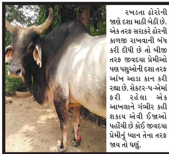
રખડતા ઢોરોની જાણે દશા માઠી બેઠી છે. એક તરફ સરકારે ઢોરની કાળજી રાખવાની બંધ કરી દીધી છે તો બીજી તરફ જીવવધ્યા પ્રેમીઓ પણ પશુઓની દશા તરફ આંખ આડા કાન કરી રહ્યા છે. સેક્ટર-૫-એમાં ફરી રહેલા એક આખલાને ગંભીર કહી શકાય એવી ઈજાઓ પહોંચી છે કોઈ જીવવધ્યા પ્રેમીનું ધ્યાન તેના તરફ જાય તો ઘણું.

ઓફિસ છૂટવાના ટાઈમે આવા ઢોર રસ્તામાં આવે ત્યારે સ્પીડમાં આવતા વાહનોને અચાનક જ બેક મારવી પડે છે અને જેને કારણે ટ્રાફિકની સમસ્યા વધે છે. ઘણા સેક્ટરોમાં રસ્તાની વચ્ચે બેઠેલા ઢોરને કારણે વાહનચાલકોને વાહન ચલાવવામાં મુશ્કેલી ભોગવવી પડી રહી છે અને જ્યારે ઘણા સેક્ટરોમાં આજે સ્ટ્રીટલાઈટ નથી ત્યારે અંધારામાં રોડ પર બેઠેલ ઢોર દેખાય નહીં તો અકસ્માત થવાનો ભય રહે છે.