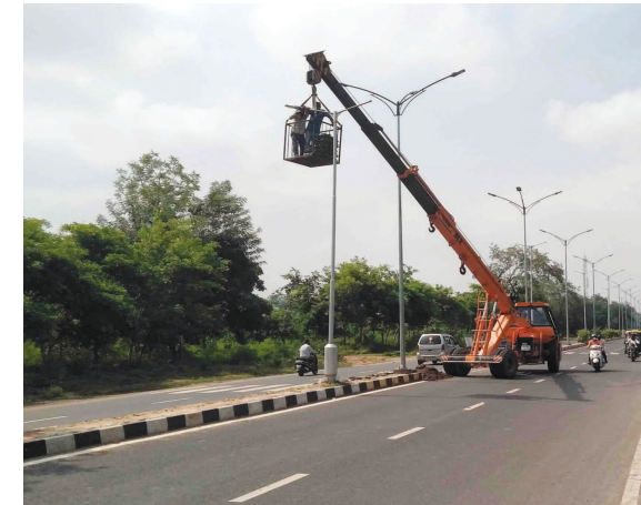
ગાંધીનગરમાં વિકાસ કાર્યોએ ગતિ પકડી છે. ઉઘાડ નીકળતા જ અનેક પ્રકારના વિકાસ કાર્યો થઈ રહ્યા છે. જ્યાં નજર કરો ત્યાં ક્યાંક માર્ગો બની રહ્યા છે તો ક્યાંક પાઈપલાઈનનું તો ક્યાંક અંડર ગ્રાઉન્ડ કેબલ નાંખવાનું કામ થઈ રહ્યું છે. નવી એલેડી સ્ટ્રીટલાઈટ નાંખવાનું કામ પણ 'ગ' રોડ પર પૂરજોશમાં થઈ રહ્યું છે. જુની સ્ટ્રીટલાઈટના થાંભલા કાઢી તેના બદલે નવા થાંભલા નાંખવામાં આવી રહ્યા છે.

હુમલો કર્યો હતો. જેમાં ફરિયાદી યુવક ખસી ગયો હતો આરોપીએ ફરીયાદી પર હુમલો કરતા યુવકે તલવાર પકડી પાડી હતી જેથી યુવકને બે હાથે અને કપાળના ભાગે ઈજા પહોંચી હતી. ઝઘડાને પગલે દોડી આવેલા સ્થાનિક નાગરિકોએ યુવકને હુમલાખોરથી બચાવ્યો હતો. યુવકને ઈજા પહોંચતા સારવાર માટે ગાંધીનગર સિવિલ લઈ ગયા હતા. યુવકે ફરિયાદ નોંધાવતા પોલીસે હત્યાના પ્રયાસનો ગુનો નોંધી ધોરણસરની કાર્યવાહી હાથ ધરી છે.