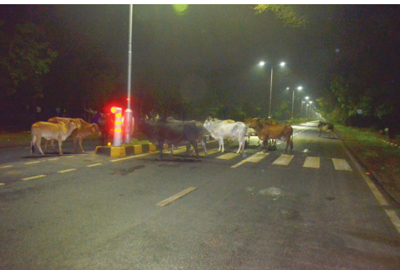
૨૪ના માર્કેટમાં રખડતા સરગાસણ અને કુડાસણમાં

પડી રહ્યો છે. નગરમાં પહેલેથી જ સે-૭, ૨૧ અને