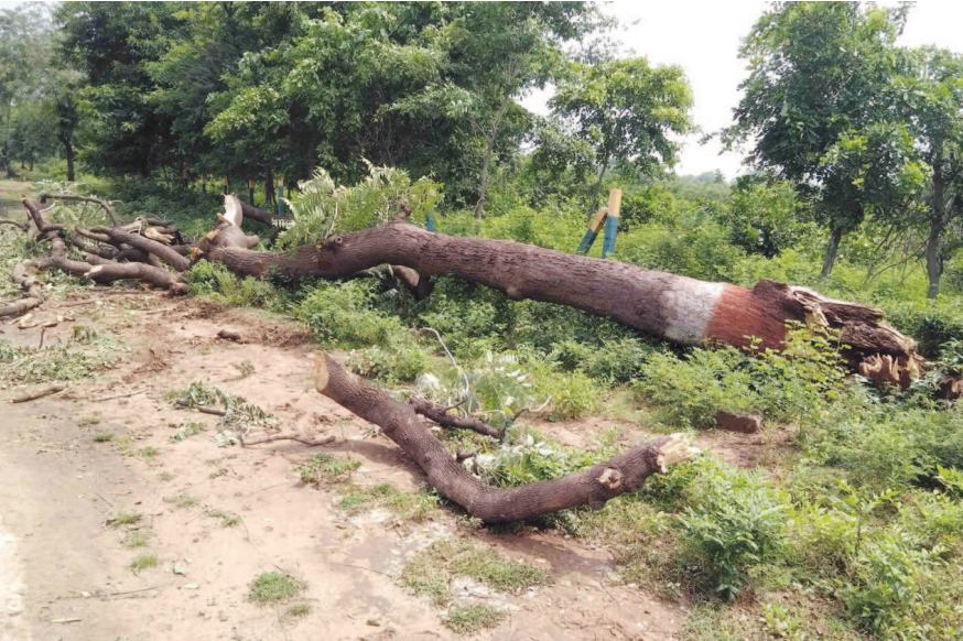
ગાંધીનગરમાં વરસાદી વાતાવરણ સાથે મીની વાવાઝોડું કુંકાતા ટેર ઠેર વૃક્ષો પડી જવાના બનાવો બન્યા હતા. વરસાદ બંધ થતાં જ વનવિભાગે આવી પડી ગયેલી ડાળીઓ કાપી ઉપાડવાનું શરૂ કર્યું હતું.