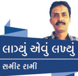
લાવું એવું લાવું સમીર તમીર

અને તકનીકી પ્રગતિ માટે એનો મોટો ફાયદો મળે છે. ભારતીય ભાષાઓ વિશ્વમાં સૌથી સમૃદ્ધ, સૌથી વધુ વૈજ્ઞાનિક, સૌથી સુંદર અને સૌથી વધુ અભિવ્યક્તિ વૈભવ ધરાવનારી છે તેથી