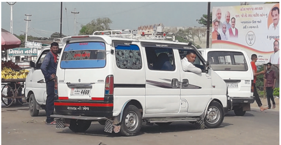
પહોળો રોડ સાંકડો બની ગયો છે, તેથી ચારે બાજુથી આવતા વાહનોના કારણે રાહદારીઓને લાઈનો લાગી જતા ટ્રાફિક ચક્કાજામ થાય છે. જેમાં વાહન ચાલકો કલાકો સુધી ખડકલાના કારણે નાના મોટા માર્ગ અકસ્માતો પણ થાય છે તેમ છતાં જવાબદાર ટ્રાફિક

હેરાનગતિ થાય છે ઉપરથી ઈકો ગાડીઓના ખડકલાથી નીકળવું પણ મુશ્કેલ બની જાય છે જેના કારણે વાહનોની અટવાય છે એટલું જ નહીં, સર્કલ ઉપર ગાડીઓના પોલીસ માત્ર તમાશો નિહાળે છે. આ બાબતે જાગૃત નાગરિકો દ્વારા દક્ષિણ પોલીસ મથકે વારંવાર રજૂઆતો કરાય છે પણ તેમની વ્યાજબી રજૂઆત હમણા હડ માલામાં ધ્યાને લેવાતી નથી તેથી ગમખવાર માર્ગ અકસ્માત સર્જવાની દહેશત વર્તાય છે. લોકમુખે ચર્ચાતી વાતો મુજબ આ રૂટ ઉપર ફરતી મોટાભાગની ઈકો ગાડી પોલીસ કર્મચારીઓની છે જેના કારણે કોઈ પગલાં ભરાતા નથી. ઉલટાનું જીપ અને અન્ય વાહનોને 'ડબલ ડોઝ' અપાય છે. જેને ગંભીરતાથી લઈ જિલ્લા પોલીસ વડા સત્વરે ઘટનાં પગલાં ભરે તેવો જનમત પ્રવર્તે છે.