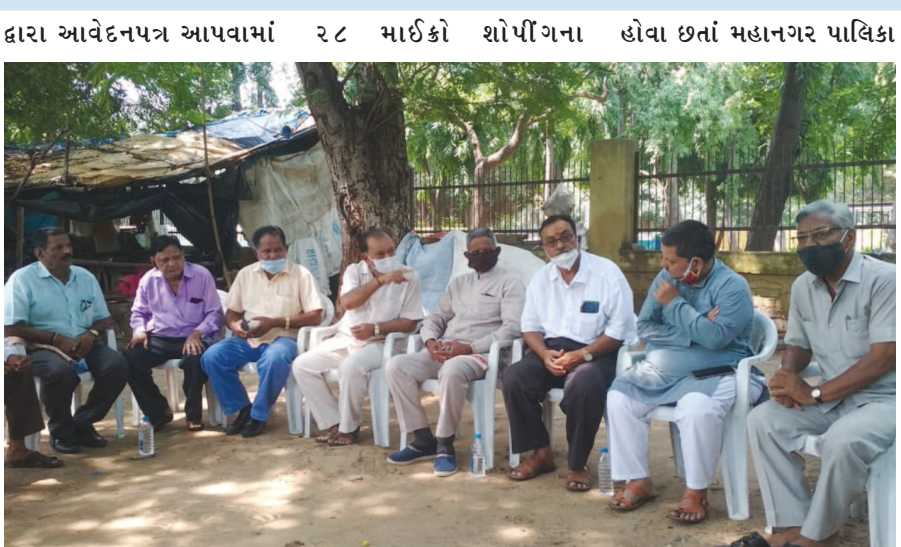
આવું હતું. આ ઉપરાંત સેક્ટર-૨૮ના વેપારીઓ સાથે યોજાયેલી બેઠકમાં રજૂઆત દ્વારા સુવિધાઓ મળતી નહીં

ગાંધીનગર, તા. ૨૨ ગાંધીનગર શહેર વસાહત મહાસંઘની એક બેઠક સેક્ટર-૨૮ના બગીચા પાસે આવેલા માર્ટ શોપીંગ સેન્ટર તથા લારી-ગલ્લાનાં વેપારીઓ સાથે મળી યોજાયેલી હતી. આ બેઠકમાં આ વર્ષ જુના લારી ગલ્લાની જગ્યાએ માર્ટ શોપીંગ બનાવવાની માંગણી સરકારમાં સ્વીકારાઈ હોવા છતાં માર્ટ શોપીંગની ફાળવણી થતી નહીં હોવા સામે રોષ વ્યક્ત કરવામાં આવ્યો હતો.