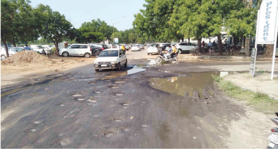
સેક્ટર-૧૧માં રામકથા મેદાન નજીકથી પસાર થઈએ એટલે માથુ ફાડી નાંખે તેવી દુર્ઘટનો સામનો કરવો પડે છે. આ પરિસ્થિતિ આજકાલની નથી. મહિનાઓથી જ આ જ પ્રકારની સ્થિતિ અહીં જોવા મળી રહી છે. કારણ કે ઉભરાતી ડહોળું પાણી આખો દિવસ રસ્તાઓ પર વહે છે. આ સમસ્યા અંગે વેપારીઓએ અનેકવાર રજૂઆત કરી હોવા છતાં આ પ્રશ્નનો ઉકેલ આવતો નથી. સતત વહેતા પાણીના કારણે અહીંના રસ્તાઓ પણ એકદમ ખરાબ થઈ ગયા છે.

ગાંધીનગરને ૨૪ કલાક શુદ્ધ પાણીની જાહેરાતને પરિષદે આવકારી : આ સાથે ચોમાસામાં ડહોળું પાણી આવવાની સમસ્યા ઉકેલવા શુષ્કિરણ અને પરિવહન સાથે સંગ્રહ ક્ષમતા વધારવા સૂચન : ડહોળા પાણી માટે જવાબદારો પર ગુનો નોંધી પગલા લેવા જોઈએ