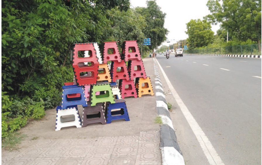
શહેરના ચ-રોડ પાસે રાજસ્થાનથી પરિવાર રોજી રોટી મેળવવા અર્થે આવ્યો છે અને ફોર્લોડિંગ સ્ટૂલના વેચાણનો ધંધો કરી રહ્યો છે. પરંતુ કોરોનાને કારણે શહેરીજનોની જરૂરિયાતો ઘટી રહી છે અને બહાર હરવા ફરવાનું પણ સાવ બંધ છે એવું થઈ ગયું છે ત્યારે ફોર્લોડિંગ સ્ટૂલની ખરીદી પણ કોઈ કરી રહ્યું નથી.

તો અમુકે પોતાની સાસરે ગયેલી દીકરીના પણ મેમરી ફોટો શેર કર્યા હતા. આજના દિવસે જાણે સોશિયલ મીડિયામાં તમામને ડોટર્સ ડે હોવાની ખુશી હોય તેમ જણાઈ રહ્યું હતું સાથે ડોટર્સ ડે વિશની ભરમાર થઈ હતી. માતા અને પિતા તમામે આ દિવસ પોતાની દિકરીને સમર્પિત કરી કનોલિટી ટાઈમ પસાર કર્યો હતો. દૂર રહેતી દીકરીને વિડીયો કોલ દ્વારા વીશ કરી ઓનલાઈન વાતો કરવામાં આવી હતી. આ સાથે માતા-પિતાએ ફોટોઝ શેર કરી વોટસએપ, ફેસબુક અને ઈન્સ્ટાગ્રામ દ્વારા પોતપોતાની દિકરીની ઓળખાણ આપી હતી.