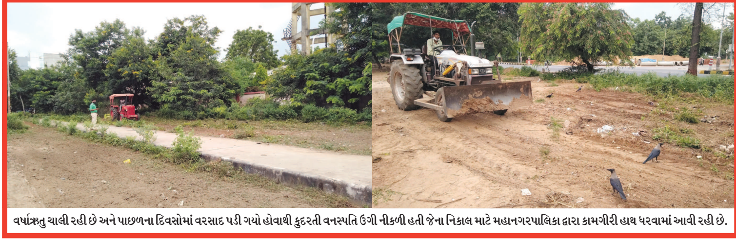
વર્ષાઋતુ ચાલી રહી છે અને પાછળના દિવસોમાં વરસાદ પડી ગયો હોવાથી કુદરતી વનસ્પતિ ઉગી નીકળી હતી જેના નિકાલ માટે મહાનગરપાલિકા દ્વારા કામગીરી હાથ ધરવામાં આવી રહી છે.

ચાલકે મહિલાના ગળામાંથી સોનાનો દોરો ખેંચી લીધો હતો. જેથી મહિલાએ હોહા કરતા બાઈક ચાલકે યુ ટર્ન મારીને બાઈક ક-૭ તરફ દોડાવી દીધુ હતું. જેથી એકટીવા લઈને પાછળ ગયા હતા, પરંતુ રાત્રીના અંધારામાં બાઈક ચાલક ચેઈન સ્નેચર્સ છું મંતર થઈ ગયા હતા. બાઈક ચાલકે મોં પર રૂમાલ બાંધીને રાખ્યો હતો અને શરીરે ગ્રે કલરની અડધી બાયની ટીશર્ટ અને વાદળી કલરનું પેન્ટ પહેર્યું હતું. બનાવ અંગે સેક્ટર-૨૧ પોલીસ મથકે રૂ.૩૫ હજારના સોનાના દોરાની ચીલઝડપ અંગે ફરીયાદ નોંધાવતા પોલીસે આગળની તપાસ હાથ ધરી છે.