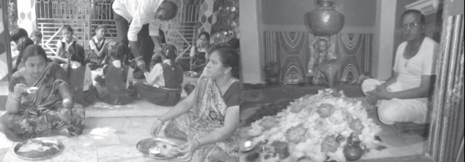
ખેડબ્રહ્મા તાલુકાના લક્ષ્મીપુરા ગામની ઉત્તરે ખેતરોની વનરાજી વચ્ચે શ્રી નિલકંઠ મહાદેવના મહંત આજીવન ફલાહાર ઉપર રહીને મહાદેવને હર હર ભોલે નાદ દ્વારા ભજી રહ્યા છે. 'એક પુરુષ એક ભિલિપત્ર', એક લોટા જલ કી ધાર, તો દયાલુ રીલ કે દેત હૈ, ચંદ મોલિ ફલ ચાર.' શ્રાવણ માસમાં કમળ પાંદડીના માટીના આકારો દ્વારા ભવ ભવના ભેરુ એવા શિવની પાર્શ્વ તથા લઘુરૂઢનું આયોજન થાય છે ત્યારે ભોળામાથના ભક્તો ભિલિપત્ર દ્વારા શ્રાવણને સોહામણો બનાવે છે. નિલકંઠ મહાદેવના સાંનિધ્યમાં મહંતશ્રી તથા ભક્તો દ્વારા દર પવિત્ર શ્રાવણની પૂર્ણાહુતી પ્રસંગે બ્રહ્મભોજન તથા ધૂમાડા બંધ ગામ જમાડવામાં આવે છે આ સાથે નિલકંઠ મહાદેવની પૂજામાં રત ભક્તજનોને દર્શાવવામાં આવેલ છે.

અત્યારના હાઈટેક યંત્ર યુગમાં લોકો માટે મનોરંજનના અનેક સાધનો ઉપલબ્ધ છે ત્યારે જૂના જમાનામાં લોકોને મનોરંજન પુરું પાડતી ભવાઈ કલાનું અસ્તિત્વ અત્યારે હાલ જોખમાયું છે. ત્યારે પ્રાંતિજ શહેરમાં ભવાઈ ભજવતા કલાકારો વિવિધ સોસાયટીમાં જઈને વેશભૂષા કરીને નાના બાળકોથી માંડીને વયોવૃદ્ધ વ્યક્તિને આનંદ અપાવી રહ્યા છે. પરંતુ અત્યારના સમયમાં કલા કરતા