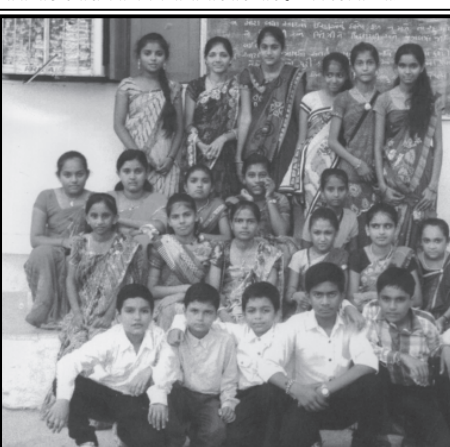
જયપ્રકાશ વિદ્યાલયમાં શિક્ષક દિનની ઉજવણી