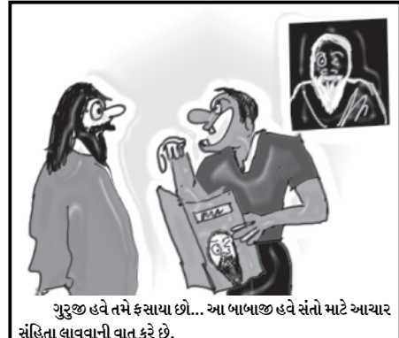
ગુરુજી હવે તમે કસાયા છો... આ બાબાજી હવે સંતો માટે આચાર સંહિતા લાવવાની વાત કરે છે.