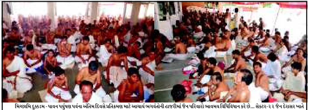
મિચ્છામિ દુકકામ - પાવન પર્યુપણ પર્વના અંતિમ દિવસે પ્રતિકમણ માટે આવાય ભગવંતોની હાજરીમાં જેન પરિવારો ભાવમય વિધિવિધાન કરે છે... સેક્ટર-૨૨ જેન દેરાસર ખાતે મહારાજ સાહેબની નિશામાં ગાંધીનગરના જેન શ્રાવકો પ્રતિકમણ માટે મોટી સંખ્યામાં ઉપસ્થિત રહ્યા હતા. પોતાની જાત સાથે ભૂલોનો એકરાર કરવાની આ આધ્યાત્મિક પરંપરા જીવનને શ્રેષ્ઠતા તરફ લઈ જવાનો માર્ગ બતાવે છે...

બોલ મારી અંબે, જય જય અંબે - જય અંબે પરિવાર પદયાત્રાના રજત જયંતિ વર્ષે આજે અંબાજી જવા ૩૦૦ ભાવિકોના સંઘે પ્રસ્થાન કર્યું હતું. માતાજીના પૂજન-અર્ચન બાદ માતાજીના જયધોષો સાથે સેક્ટર-૧ ૩ના જયઅંબે ચોકમાંથી ભાવિકોને વિદાય આપવા નાગરિકો મોટી સંખ્યામાં ઉપસ્થિત રહ્યા હતા.