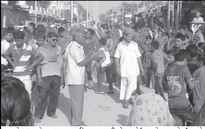
ખેડબ્રહ્મા ખાતે રાજસ્થાનના પ્રજાપતિ સમાજ દ્વારા શ્રીયાદે માતાનો ઉત્સવ સોમવારના રોજ ઉજવાયો હતો. જેમાં શ્રીયાદે માતાજીનો મંદિરેથી વરધોડો નીકળી શહેરના માર્ગો પર ફરી નિજ મંદિર પરત ફર્યા હતા. ત્યારબાદ મહાપ્રસાદનું આયોજન કરવામાં આવ્યું હતું.