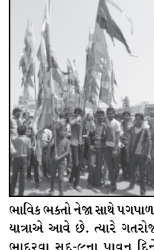
ભાવિક ભક્તો નેજા સાથે પગપાળા યાત્રાએ આવે છે. ત્યારે ગતરોજ ભાદરવા સુદ-૯ના પાવન દિને રાજસ્થાન રજીન્દ્ર ધામે મહામેળો ભરાય છે. અને ભાવિક ભક્તો દ્વારા નવકળી નેજા ચડાવાયા છે. જે અનુસંધાને બનાસકાંઠા જિલ્લામાં પણ ગતરોજ ભાવિક ભક્તો દ્વારા ડીજેના તાલે રમતા ઝુમતા બાબાના વિવિધ મંદિરોએ હરબભેર બાબા રામદેવપીરની આરતી, પુજા બાદ ભોજન પ્રસાદનું આયોજન કરાયું હતું. જેમાં મોટા પ્રમાણે ભાવિકોએ

ડીસા, તા. ૧૫ રાજસ્થાનના ઝણિયા ધામમાં હાજરા હજુર અને અપરંપાર પરચા પુરનારા હિન્દવાપીર બાબા રામદેવના પાવન ધામ રજીન્દ્ર ખાતે દર વર્ષે લાખોની સંખ્યામાં દૂર દુરથી દર્શન પ્રસાદનો લાભ લીધો હતો. જેમાં ડીસા શહેરના હાઈસમા નવા બસ સ્ટેન્ડની સામે રાણપુર જવાના માર્ગ પર બનાવાયેલ સંગે મર મરના બાબા રામદેવ પીરના મંદિરે વહેલી સવારે સમગ્ર નગરની પરિક્રમા બાદ વાજતે ગાજતે ઢોલ નગારા અને અબિલ ગુલાબની છોળો વચ્ચે નેજા ચડાવાયા હતા. તદ્દપરાંત શહેરના વિવિધ નાના-મોટા રામદેવપીરના મંદિરો પર તેમજ રહેણાંક વિસ્તારમાં લીમડાના ઝાડ પર ભારે હર્ષોલ્લાસ અને ભક્તિ ભાવ પૂર્વક નેજા ચડાવી બાબા રામદેવ પીરના આદિપ મેળવ્યા હતા. જિલ્લાના ડીસાના અંતરિયાળ વિસ્તાર ભોંપાનગર, રાજપુર, પાલનપુર, ધાનેરા, અંબાજી, દાંતા, વડગામ, શિહોરી, થરાદ, લાખણી, લાલપુર, વાવ, દિયોદર, ભાભર તેમજ અન્ય સ્થળોએ ભાવિક ભક્તો દ્વારા બાબા રામદેવ પીરના મંદિરે નેજા ચડાવાયા હતા.