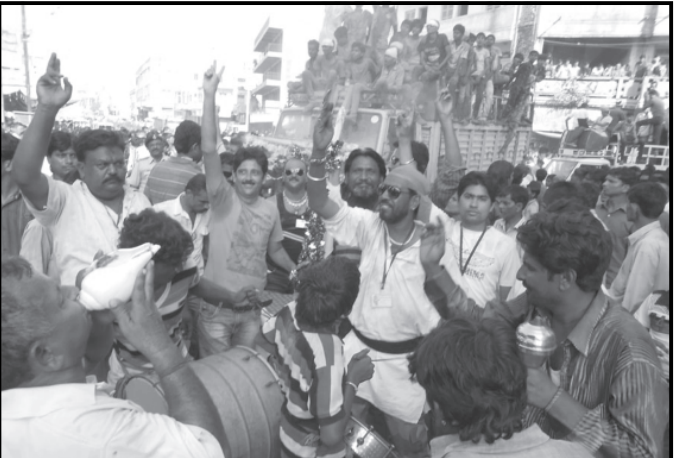
વેપારી મથક ડીસા શહેરમાં દર વર્ષે ભાદરવા સુદ અગિયારસના દિવસે જલજીલણી એકાદશીની વિશાળ શોભાયાત્રા યોજાયી છે. આ શોભાયાત્રામાં ભગવાનની શાહી સવારી નગરમાં પરીભ્રમણ કર્યા બાદ બનાસ નદીના તટ પર પહોંચે છે. જ્યાં ભગવાનને સ્નાન વિધિ કરાવી આ શોભાયાત્રા મંદિરે પરત ફરે છે. દર વર્ષની જેમ ગતરોજ ડીસામાં યોજાયેલી જલજીલણી એકાદશીની વિશાળ શોભાયાત્રા પણ આકર્ષણનું કેન્દ્ર બની હતી. ડીસા ખાતે શોભાની રીસાલેશ્વર મહાદેવજીના મંદિરેથી પ્રારંભાયેલી આ શોભાયાત્રાને મંદિરના મહંત તેમજ અન્ય અગ્રણીઓની ઉપસ્થિતિમાં વિધિવત રીતે પ્રસ્થાન કરાયું હતું. દરમિયાન આ શોભાયાત્રા જેમ જેમ આગળ વધી તેમ તેમ વિવિધ વિસ્તારોમાંથી ગણેશજીની વિસર્જન યાત્રાઓ પણ આ શોભાયાત્રા સાથે જોડાતાં ભગવાન શ્રીકૃષ્ણ તેમજ દુર્વાળાદેવ ગણેશજીના જયનાદથી ડીસા શહેરનું ગગન ગાજી ઉઠ્યું હતું. ગતરોજ બપોરે ડીસાના રીસાલા ચોકમાંથી નિકળી નગરના મુખ્ય માર્ગ પર ફરેલી આ શોભાયાત્રામાં વાહનોના કાફલા ઉપરાંત અન્ય ગાંભીરો પણ આકર્ષણનું કેન્દ્ર બની હતી. આ શોભાયાત્રા સાથે ગણેશજીની વિસર્જન યાત્રાઓ પણ જોડાયા બાદ દુર્વાળા દેવને ભાવભરી વિદાય અપાઈ હતી.