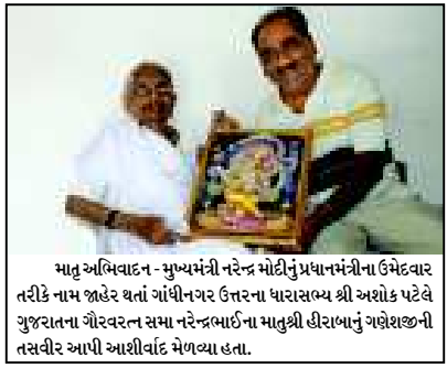
માતૃ અભિવાદન - મુખ્યમંત્રી નરેન્દ્ર મોદીનું પ્રધાનમંત્રીના ઉમેદવાર તરીકે નામ જાહેર થતાં ગાંધીનગર ઉત્તરના પારાસભ્ય શ્રી અશોક પટેલે ગુજરાતના ગૌરવરત્ન સમા નરેન્દ્રભાઈના માતૃશ્રી હીરાબાનું ગણેશજીની તસવીર આપી આશીર્વાદ મેળવ્યા હતા.

ગાંધીનગર, તા. ૧૬ શહેરમાં નવનિર્મિત શૌચાલયોના તાળા હજુ પુલ્યા નથી. જૂના શૌચાલયો ખંડેર હાલતમાં બિનઉપયોગી હોવાનું ચિત્ર ઉપસી આવ્યું છે. બંધ શૌચાલયોમાં દૂષણો પાંગરતા હોવાની વ્યાપક ફરિયાદો ઉદભવી છે. આમ છતાં કંગાળ આમ છતાં શૌચાલયોને હજુ તાળા વાગેલા હોવાથી આમનાગરિકોમાં ઉગ્ર આકોશ પ્રવર્ત્યો છે. છેલ્લા બે વર્ષથી આ મામલે કોઈ નિવેદો આવતો નથી. શહેરમાં એકબાજુ દાયકાઓ જૂના શૌચાલયો ખંડેર હાલતમાં બિનઉપયોગી હોવાનું ચિત્ર ઉપસી આવ્યું છે. બંધ શૌચાલયોમાં દૂષણો પાંગરતા હોવાની વ્યાપક ફરિયાદો ઉદભવી છે. આમ છતાં કંગાળ આમ છતાં શૌચાલયોને હજુ તાળા વાગેલા હોવાથી આમનાગરિકોમાં ઉગ્ર આકોશ પ્રવર્ત્યો છે. છેલ્લા બે વર્ષથી આ મામલે કોઈ નિવેદો આવતો નથી.