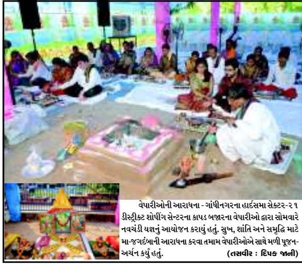
વેપારીઓની આરાધના - ગાંધીનગરના હાર્દસમા સેક્ટર-૨૨ ૧ ડીસ્ટ્રીક્ટ શોપીંગ સેન્ટરના કાપડ બજારના વેપારીઓ દ્વારા સોમવારે નવચંદી યજ્ઞનું આયોજન કરાયું હતું. સુખ, શાંતિ અને સમૃદ્ધિ માટે મા-જગદંબાની આરાધના કરવા તમામ વેપારીઓએ સાથે મળી પૂજન-અર્ચન કર્યું હતું.