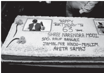
વિવિધ વર્ગો આગેવાનો, વ્યક્તિ, વિશેષ, મહાનુભવો અને પ્રજાનો ચાલુ રહ્યો હતો. મુખ્યમંત્રી નરેન્દ્ર મોદીએ

સમાજલક્ષી કાર્યક્રમો યોજાયા હતા. શહેરના તમામ વોર્ડમાં આવેલ આંગણવાડીઓમાં સ્થાનિક ધારાસભ્યો તથા કોર્પોરેટરોએ બાળકોને ખજૂર, સીંગ તથા ગોળના પોપણપુકત લાડુ વહેંચ્યા હતા. આ ઉપરાંત ચોકલેટ, બિસ્કીટ અને રમકડાંનું પણ વિતરણ કરવામાં આવ્યું હતું. જ્યારે જગસાથ મંદિરે કરવામાં આવેલ મહાઆરતીમાં મેયર મિનાક્ષાબેન પટેલ, પ્રદેશ ઉપપ્રમુખ કૌશિક પટેલ, આઈ. કે. જાડેજા, શહેર પ્રમુખ રાકેશ શાહ સહિત સેંકડો કાર્યકરો ભાગ લીધો હતો.