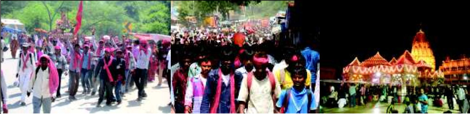
શ્રદ્ધાનું ઘોડાપુર - બોલ મારી અંબે, જય જય અંબેના જયધોષથી મંગળવાર અને બુધવારે અંબાજીધામ ગાજી ઉઠવું હતું અને હજુ આજે સૌથી વધુ ભાવિકો ઉમટવાનો અંદાજ છે.... આજે ભાદરવી પૂનમના મેળામાં ગુજરાતના ખૂણે ખૂણેથી શ્રદ્ધાભિંદુ સમા મા-આવશક્તિપીઠ લાખો ભાવિકોથી છલકાઈ રહ્યું છે.... અંબાજીના તમામ માર્ગો પહચાનીઓથી ઉભરાય છે... ભાદરવી પૂનમનો મેળો આ વર્ષે ભૂતકાળના તમામ વિક્રમો તોડી ૨૫ લાખ જેવી વિક્રમી દર્શનાર્થીઓની સંખ્યા થશે... આજે રાજ્યભરમાંથી વાહનો દ્વારા અંબાજી પહોંચનારાઓની સંખ્યા પણ ૩ થી ૫ લાખની ગણાય છે.... અંબાજી તરફના તમામ માર્ગો ગુરુવારે વાહનોની ટ્રાફિક ક્ષી જામ બનવાના સંકેતો પણ છે... આજે આપણે સૌ આજના પાવન પરવે મા-આવશક્તિના ચરણોમાં પ્રાર્થાએ કે ગુજરાત સહિત દેશભરમાં સુખ, શાંતિ અને સમૃદ્ધિ સતત જળવાઈ રહે... સૌને જયઅંબે (સત્યવાર : હરશે જોયો, પાલનપુર)