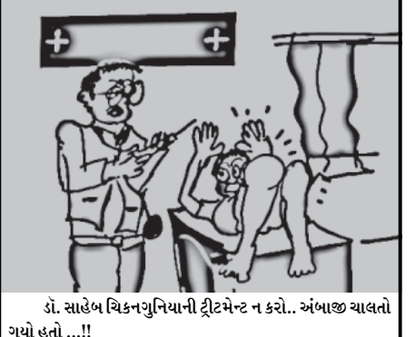
ડૉ. સાહેબ ચિકનગુનિયાની ટ્રીટમેન્ટ ન કરો... અંબાજી ચાલતો ગયો હતો.....!