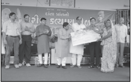
દેશના લોકો આતુર છે તે આપણા માટે આનંદ અને ગૌરવની ભાવલ છે ત્યારે આપણે સૌ સક્રિય અને સંકલ્પબળથી બની પુરતુ યોગદાન આપીએ. તેમણે લાભાર્થીઓને અનુરોધ કર્યો કે અત્રેથી મળેલ લાભનો કાળજીપૂર્વક અને પુરુષાર્થ વડે સરસ ઉપયોગ કરીને -ગતિ કરીએ. તેમણે કહ્યું કે રાજ્યમાંથી ગરીબીના દુષણને હમેશ માટે

લોકલાડીલા મુખ્યમંત્રીશ્રી નરેન્દ્રભાઈ મોદીને દિલ્હીની શાસનપુરા ઉપર બેસાડવા સમગ્ર દેશના લોકો આતુર છે. તેમણે કહ્યું કે છેલ્લા દસકામાં મુખ્યમંત્રીશ્રી મોદીના શાસનમાં રાજ્યમાં તમામ ક્ષેત્રોમાં વિકાસ થયો છે તેનાથી સર્વાંગી વિકાસ માટે રાજ્ય સરકાર સમગ્ર દેશને વિકાસ અને સુશાસનની નવી દિશા મળી છે. તેમણે કહ્યું કે ગરીબ કલ્યાણ મેળાઓને લીધે લાખો ગરીબ પરિવારોના જીવનમાં સુખમય ચોંધરીએ જણાવ્યું કે આપણા પરિવર્તન આવ્યું છે.