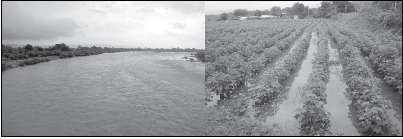
મિલોડા તાલુકાના ટોરડા મુશળધાર વરસાદ ખાબક્યો હતો નીચાણવાળા વિસ્તારોમાં ડેર-ઢેર છે ત્યારે મગફળીના તૈયાર થયેલા પાક રૂપિયાનું નુકશાન સહન કરવાનો વારો ઉપર આકતનો ખતરો છે. પાછોતરા આવ્યો છે ત્યારે ખેડુતોને પાક વિમો શામળાજી, દહવાવ, ચિઠોડા, રેવાસ, મળશે કે કેમ? તે પ્રાણ પ્રશ્ન ખેડુતોને સુનોબ, ટાકાટુકા, ટોરડા, પાલ્લા, ખેરાડી સહિત વિવિધ વિસ્તારોમાં પાછોતરા વરસાદે ખેડુતોની આશા ડુબાડી દેતા ખેડુતોને હવે માથે પોક મુકી રોવાનો વારો આવ્યો છે. હંમેશા ખેડુતોનું નસીબ ચાર ડગલા પાછળ જ હોય છે. મિલોડા હાથમતી નદીના બ્રીજ ઉપર મોટા-મોટા ખાડા પડી ગયા હોવાના કારણે વાહન ચાલકો હેરાન પરેશાન બન્યા છે ત્યારે ક્યારેક અકસ્માત થવાની સંભાવના સેવાઈ રહી છે. લાગતા-વળતા તંત્રના જવાબદાર અધિકારીઓ ધ્વારા હાથમતી નદી ઉપરના બ્રીજ ઉપરના રોડનું સમારકામ કરવામાં આવે તેવી પ્રબળ લોકમાંગણી છે. મિલોડા તાલુકામાં મોસમનો આજ દિન સુધીનો ૧૦૫૧ મી.મી. વરસાદ નોંધાયો છે. આકાશમાં કાળા કાળાં વાદળો ઘેરાયેલા રહેતા હોવાના કારણે વધુ વરસાદ આવશે તો ખેડુતો મુકેલીમાં મુકારી.

મિલોડા, તા.૨૯ પછા ૩૦ મી.મી. વરસાદ થતાં વીજ પુરવઠો ખોરવાયો હતો. ઈન્દ્રાસી નદી બે કાંઠે વહેતી થઈ હતી. તાલુકામાં મગફળીનું આશરે ૨૩૦૦ વરસાદના કારણે મગફળીનો પાક મળશે કે કેમ? તે પ્રાણ પ્રશ્ન ખેડુતોને સુનોબ, ટાકાટુકા, ટોરડા, પાલ્લા, ખેરાડી સહિત વિવિધ વિસ્તારોમાં પાછોતરા વરસાદે ખેડુતોની આશા ડુબાડી દેતા ખેડુતોને હવે માથે પોક મુકી રોવાનો વારો આવ્યો છે. હંમેશા ખેડુતોનું નસીબ ચાર ડગલા પાછળ જ હોય છે. મિલોડા હાથમતી નદીના બ્રીજ ઉપર મોટા-મોટા ખાડા પડી ગયા હોવાના કારણે વાહન ચાલકો હેરાન પરેશાન બન્યા છે ત્યારે ક્યારેક અકસ્માત થવાની સંભાવના સેવાઈ રહી છે. લાગતા-વળતા તંત્રના જવાબદાર અધિકારીઓ ધ્વારા હાથમતી નદી ઉપરના બ્રીજ ઉપરના રોડનું સમારકામ કરવામાં આવે તેવી પ્રબળ લોકમાંગણી છે. મિલોડા તાલુકામાં મોસમનો આજ દિન સુધીનો ૧૦૫૧ મી.મી. વરસાદ નોંધાયો છે. આકાશમાં કાળા કાળાં વાદળો ઘેરાયેલા રહેતા હોવાના કારણે વધુ વરસાદ આવશે તો ખેડુતો મુકેલીમાં મુકારી.