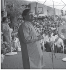
પટેલના અધ્યક્ષસ્થાને નન્દ કશાનો ગરીબ કલ્યાણ મેળો યોજાયો હતો. આ -સંગે અધ્યક્ષશ્રી પટેલ અને મહાનુભાવોના હસ્તે દાંતા અને અમીરગઢ તાલુકાના કુલ-૩૩૧૦ લાભાર્થીઓને રૂ. ૫.૩૭ કરોડની સાધન સહાયનું વિતરણ કરવામાં આવ્યું હતું. આ -સંગે અધ્યક્ષશ્રીએ નાસંગિક -વચન કરતાં જણાવ્યું હતું કે વિકાસપુરુષ તરીકે વિસ્તરમાં -સિધ્ધ એવા આપણા લોકલાડીલા

લાભાર્થીઓને પ.૩૭ કરોડની સહાયનું વિતરણ કરાયું મિટાવી દેવા રાજ્ય સરકાર ગરીબ કલ્યાણ મેળાઓ યોજાને એક જ પ્લેટફોર્મ પરથી વિવિધ વિભાગોની જંગી સાધનસહાયના લાભોનું ગરીબોને એક જ સમયે અને એક સાથે વિતરણ કરવામાં આવે છે. અધ્યક્ષશ્રી દેસાઈએ કહ્યું કે આદિજાતિ લોકો અને તે વિસ્તારોના સર્વાંગી વિકાસ માટે રાજ્ય સરકાર દ્વારા રૂ. ૧૮,૦૦૦ કરોડનું જંગી અનુરોધ કર્યો કે અત્રેથી મળેલ વડે સરસ ઉપયોગ કરીને -ગતિ -ગતિ થઈ છે. તેમણે લાભાર્થીઓને અનુરોધ કર્યો કે અત્રેથી મળેલ લાભનો કાળજીપૂર્વક અને પુરુષાર્થ ગરીબીના દુષણને હમેશ માટે