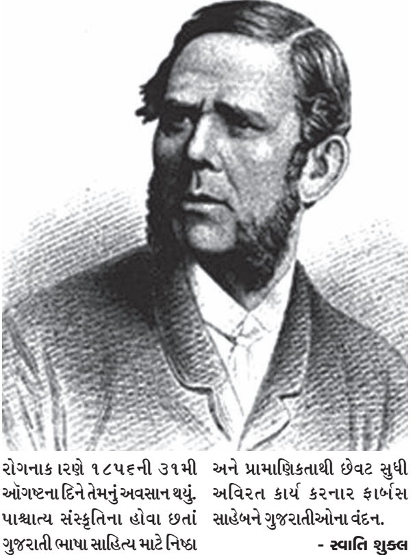
રોગનાકારણે ૧૮૬૫ની ૩૧મી ઓગષ્ટના દિને તેમનું અવસાન થયું. પાશ્ચાત્ય સંસ્કૃતિના હોવા છતાં ગુજરાતી ભાષા સાહિત્ય માટે નિષ્ઠા અને પ્રામાણિકતાથી ઇવટ સુધી અવિરત કાર્ય કરનાર ફાર્બસ સાહેબને ગુજરાતીઓના વંદન. - સ્વાતિ શુક્લ

ગુજરાતના સાંસ્કૃતિક નવોત્થાનનું મંગલાચરણ કર્યું એટલું જ નહીં, પણ ગુજરાતનું પહેલું સામયિક 'અમદાવાદ વર્તમાન' પણ તેમણે જ શરૂ કર્યું, જેને બુધવારિયું પણ કહેવામાં આવતું. એકસાથે અનેક પ્રવૃત્તિઓ તેઓ કરતા. આ જ સમયે તેમણે સાદરામાં રાજકુમારોને શિક્ષણ આપતી સ્કોટ કોલેજ સ્થાપી જ્યાં કવિ ન્હાનાલાલ પ્રિન્સિપાલ તરીકે રહ્યા હતા. ૧૮૬૫ના માર્ચની પચીસમી તારીખે મુંબઈના કેટલાંક સુપ્રસિદ્ધ ગુજરાતીઓની સભા ફાર્બસ સાહેબના બંગલે મળે. જેમાં 'ગુજરાતી સભા' સ્થાપવાનો નિર્ણય થયો. 'ફાર્બસ ગુજરાતી સભા' માટે તેમને એટલી મમતા હતી કે માંદગીને કારણે તેમણે ઘણાં કામ છોડી દીધાં હોવા છતાં ગુજરાતી સભાની જવાબદારી ઇવટ સુધી નિભાવી. માંદગી વધતી ગઈ અને મગજના