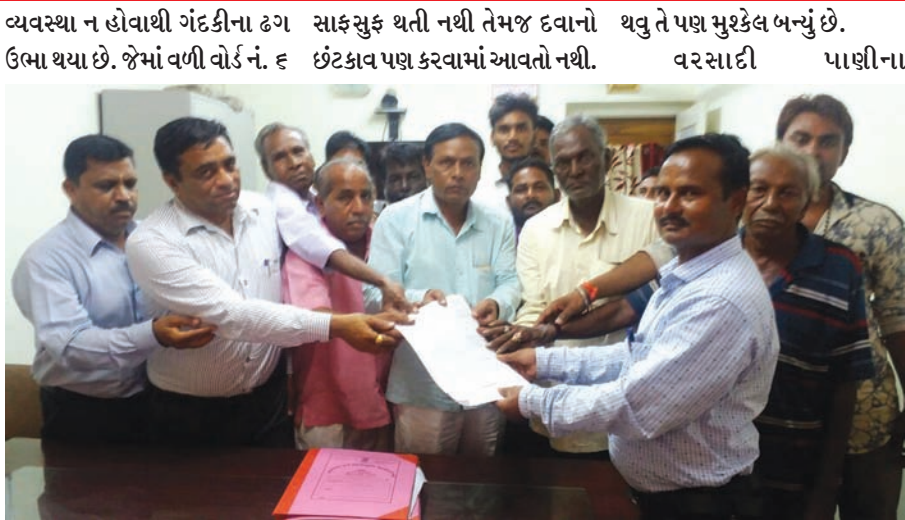
કે જેમાં શ્રમજીવી વસાહતોની સંખ્યા વધુ છે ત્યાં કાદવ, કીચડ તેમજ મુલ્લી બનાવેલ નહેરો ગંદા પાણી, લીલ અને ઝાડના પાંદડાઓથી ખદબદી રહી છે. જે સમયસર આનંદ પાર્ક પાસેથી વસાહત તરફ જવાનો રસ્તો પાણીમાં ગરકાવ થઈ ગયો છે જેથી રામનગર, અંબિકાનગર, માણેકલાલ માસ્તરની ચાલી વગેરે વિસ્તારમાં ચાલતા પસાર

તલોદ, તા. ૧ તલોદ શહેરમાં ભુગર્ભ ગટર તથા પાણીની લાઈનોના ખોદકામ પછી જમીનને સમતળ ના કરતાં ઠેર ઠેર વરસાદી પાણી ભરાઈ ગયા છે. મુખ્ય નવીન બનાવેલ માર્ગની આજુબાજુ પણ ગંદા પાણીના ખાબોચીયા ભરાયા છે. જેથી કાદવ-કીચડ સહિત સજીવિય ગંદકીના સામ્રાજ્યથી રોગચાળાની દહેશત ઉભી થઈ છે. વધુમાં શહેરના વોર્ડોમાં જવા-આવવાના રસ્તા તુટી જતાં ચાલવુ પણ મુશ્કેલ બની ગયું છે. તંત્રની સ્વચ્છતા કામગીરીને વિશાળ ફલક ઉપર લઈ જઈ તેજ ગતિએ કામગીરી હાથ ધરવા શહેરના પ્રજાજનોએ માંગ કરી છે. શહેરના જુદા જુદા વિસ્તારોમાં વરસાદી પાણીના નિકાલની યોગ્ય