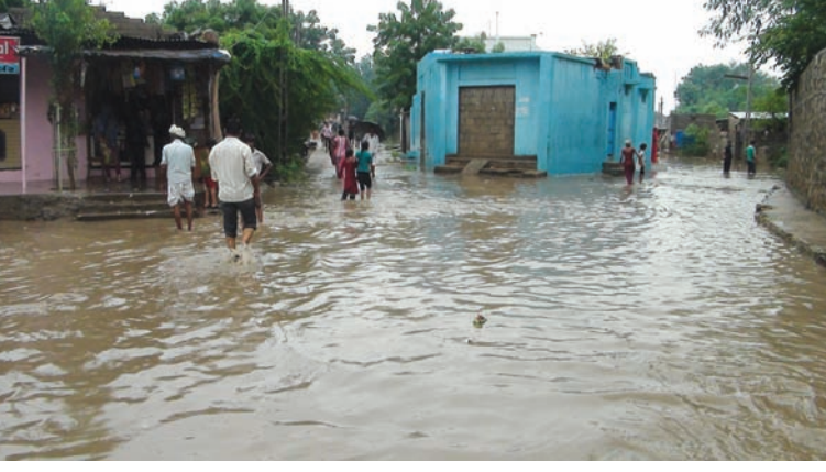
ધાનેરામાં મેઘરાજા મન મુકીને વરસ્યા ધાનેરા સહીત સમગ્ર જિલ્લામાં મેઘરાજા મન મુકીને વરસ્યા છે. ત્યારે ધાનેરા શહેર સહીત રહેણાંક વિસ્તારમાં જળબંબાકાર જેવી સ્થિતિ સર્જાઈ છે. લોકોને ઘરમાંથી બહાર નીકળવું મુશ્કેલ બની ગયું છે. તો બીજી તરફ જાહેર રસ્તા પાણીમાં ધોવાઈ જતા વાહન વ્યવહાર પણ અટવાઈ જવા પામ્યો છે. લોકોના ઘરોમાં પણ પાણી ઘુસી ગયા છે તો બીજી તરફ લોકોને ઘરમાંથી નીકળવુ પણ મુશ્કેલ બની ગયું છે. તો બીજી તરફ જાહેર રસ્તા પાણીમાં ધોવાઈ જતા વાહન વ્યવહાર પણ અટવાઈ જવા પામ્યો છે.