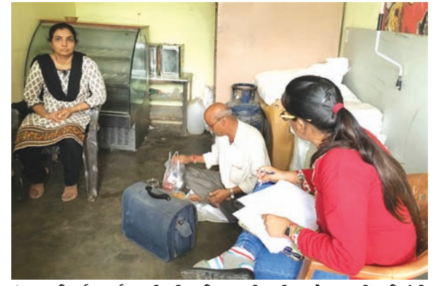
ઉધ્ધતાઈપૂર્વક વર્તન કરી મીઠાઈ તેમની દુકાનમાંથી ખરીદવામાં આવી નથી તેમ હળાહળ ખોટું બોલતા ફરીયાદ કરવા આવેલા યુવાનો ઉભતાઈ ગયા હતા અને આ દુકાન માલીકને પાઠ ભણાવવા તેમજ અન્ય લોકોના સ્વાસ્થ્ય સાથે ચેડા ન થાય તે માટે જિલ્લા વહીવટીતંત્રના પુરવઠા વિભાગ તંત્રને અરજી આપતા જિલ્લા પુરવઠા અધિકારી, ફૂડ એન્ડ ડ્રગ્સ આવી હતી ત્યારે પણ મીઠાઈમાંથી દુર્ગંધ આવવાની સાથે મીઠાઈનો સ્વાદ ખાટો જણાતા મીઠાઈનો નાશ કરી દીધો હતો. પરંતુ સોમવારે ખરીદાયેલી મીઠાઈ આરોગ્યવાથી પથી વધુ લોકોને ફૂડ પોઈઝનીંગની અસર થતા નકલી મીઠાઈ વેચતા વેપારીને પાઠ ભણાવવા જિલ્લા પુરવઠા અધિકારીને જાણ કરી સખ કાર્યવાહી કરવા અરજી આપવામાં આવી હતી.

મંદિરમાં દર્શનાર્થે આવતા ભક્તોને પ્રસાદી તરીકે આપવા વિવિધ મીઠાઈની ખરીદી કરી હતી. આ મીઠાઈ સ્વાદમાં ખાટી લાગતા તેમજ પ્રસાદ સ્વરૂપે લીધેલી મીઠાઈથી ડુધરવાડા ગામના પથી વધુ લોકોને ફૂડ પોઈઝનીંગની અસર થતા ઉલ્ટીઓ શરૂ થવા માડાસા યુવાનોને તેમને ખરીદેલી મીઠાઈમાં ગરબડ જણાતા આ અંગે રસમલાઈ સ્વીટ માર્ટના દુકાનના માલીકનો સંપર્ક કરતા ઉલ્ટા ચોર ક્રેટવાલ કો ડાંટે તેમ માલીક દ્વારા યુવાનો સાથે વિભાગ અને નગરપાલિકા તંત્ર દ્વારા સંયુક્ત દરોડા પાડવામાં આવતા રસમલાઈ સ્વીટ માર્ટનો માલિક હાંકળોકાંકળો બની ગયો હતો. સંયુક્ત ટીમ દ્વારા તેના રહેઠાણ પર પણ દરોડા પાડી સેમ્પલ લઈ કાર્યવાહી હાથ ધરી હતી. રસમલાઈ સ્વીટ માર્ટ પર મંગળવારે બપોરે ૩ વાગ્યાની આસપાસ દરોડા પડતા લોકોના ટોળેટોળા ઉમટી પડ્યા હતા. ડુરવાડાના યુવાનોના જણાવ્યા અનુસાર અગાઉ આ રસમલાઈ નામની દુકાનમાંથી ત્રણવાર ખરીદી કરવામાં