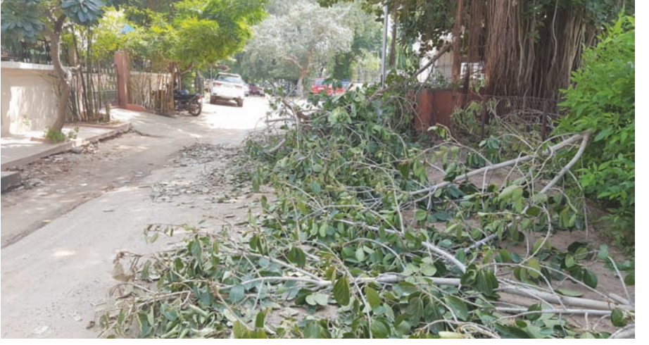
સે-૮ બી ખાતે વૃક્ષોના ટીમીંગ બાદ કચરો માર્ગ વચ્ચે ખડકી દેવાતા વાહન ચાલકો માટે અવરોધ ઉભો થયો છે. જેના કારણે સેક્ટરવાસીઓને હાલાકી વેઠવી પડી રહી છે.