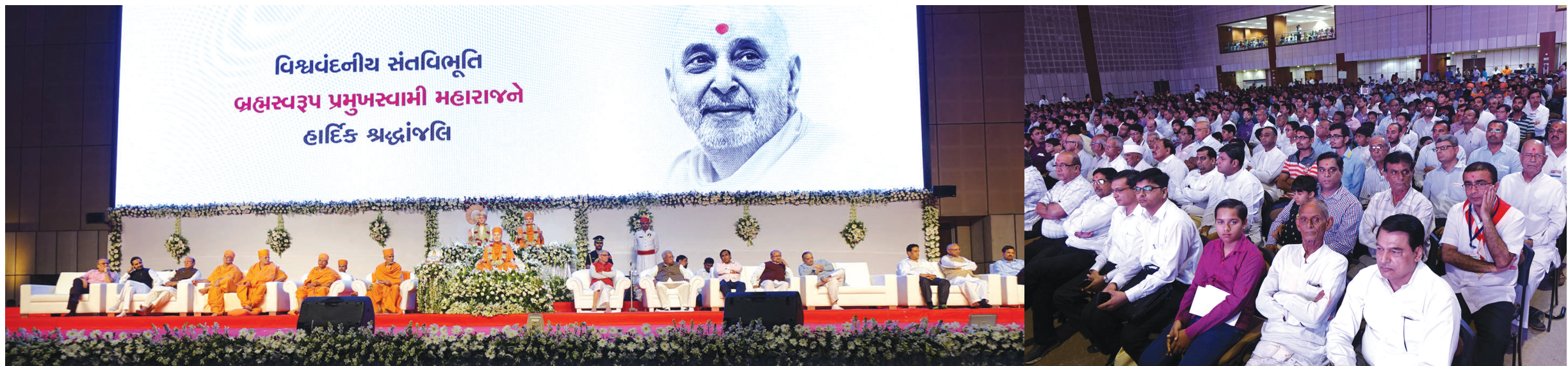
શ્રદ્ધાંજલિ સમારોહ - વિશ્વ વંદનીય પૂજ્ય પ્રમુખસ્વામીને ભાવજાલિ આપવા ગાંધીનગર મહાત્મા મંદિર ખાતે યોજાયેલ શ્રદ્ધાંજલિ સમારોહમાં ભાવિકોએ અને મહાનુભાવોએ પૂજ્ય બાપાને સ્મૃતિઓ વાગોળી અંજલિ આપી હતી... રાજ્યપાલ અને પૂજ્ય મહંત સ્વામી સહિત મંચસ્થ મહાનુભાવોએ પૂજ્ય પ્રમુખસ્વામીને પુષ્પાંજલિ અને શબ્દાંજલિ આપી હતી... ભાવિકો પણ મોટી સંખ્યામાં ઉપસ્થિત રહ્યા હતા...