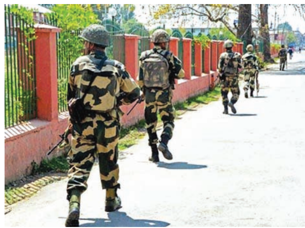
● અનુસંદાન પાન-૭ પર

શ્રીનગર, તા. ૭ જમ્મુ કાશ્મીરના કુપવાડા જિલ્લામાં આજે સવારે સેનાના કાફલા પર ફરી એકવાર ભીષણ હુમલો કરવામાં આવ્યો હતો. આ હુમલામાં ત્રણ જવાન ઘાયલ થઈ ગયા હતા. ઘાયલ થયેલા જવાનો પૈકી એકની હાલત ગંભીર જણાવવામાં આવી છે. આ હુમલો એવા સમય પર કરવામાં આવ્યો છે જ્યારે કાશ્મીરમાં સ્થિતિને સામાન્ય બનાવવા માટેના તમામ પ્રયાસ કરાઈ રહ્યા છે. પોલીસના કહેવા મુજબ ત્રાસવાદીઓએ હેન્ડગ્રાનામાં કાલ