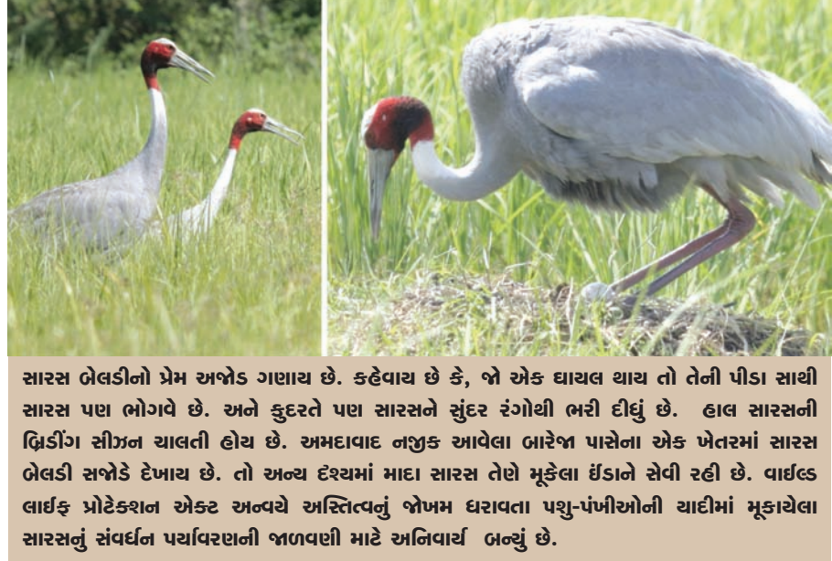
સારસ બેલડીનો પ્રેમ અખેડ ગણાય છે. કહેવાય છે કે, જો એક ઘાયલ યાચ તો તેની પીડા સાથે સારસ પણ ભોગવે છે. અને કુદરતે પણ સારસને સુંદર રંગોથી ભરી દીધું છે. હાલ સારસની ડિલિંગ સીઝન ચાલતી હોય છે. અમદાવાદ નજીક આવેલા ભારેજ પાસેના એક ખેતરમાં સારસ બેલડી સજોડે દેખાય છે. તો અન્ય દેશમાં માદા સારસ તેણે મૂકેલા ઈંડાને સેવી રહી છે. વાર્ધક લાર્ફ પ્રોટેક્શન એક્ટ અન્વયે અસ્તિત્વનું જોખમ ધરાવતા પશુ-પંખીઓની યાદીમાં મૂકાયેલા સારસનું સંવર્ધન પચાવરણની જાળવણી માટે અનિવાર્ય બન્યું છે.