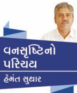
વનસ્પતિનો પરિચય હેમંત સુથાર