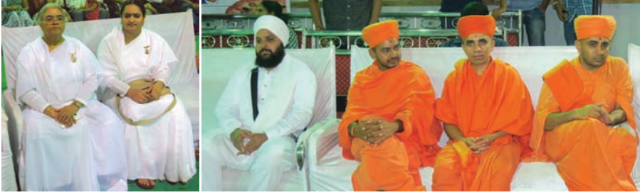
શ્રી ભુવનેશ્વર યુવક મંડળ આયોજિત ગણેશોત્સવને આશીર્વાદ પાઠવવા દર વર્ષની જેમ આ વખતે પણ વિવિધ ધર્માના ધર્મગુરુઓ ઉપસ્થિત રહ્યા હતા. તેમના હસ્તે દિપ પ્રાગટ્ય બાદ નાટક 'પિતૃ દેવો ભવ'નું મંચન કરવામાં આવ્યું હતું.