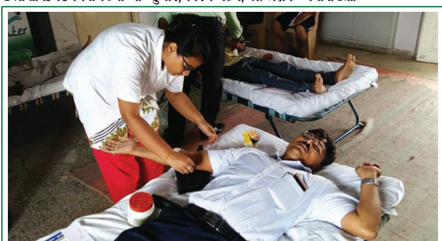
ગણેશ મહોત્સવ નિમિત્તે મહારાષ્ટ્ર સમાજ, સેક્ટર-૨૧ દ્વારા રક્તદાન શિબિરનું આયોજન કરવામાં આવ્યું હતું. આ સેવાકાર્યમાં ગાંધીનગર સિવિલ હોસ્પિટલની બ્લડ બેન્કની ટીમનો સહયોગ પ્રાપ્ત થયો હતો. ૪૨ જેટલા સેવાભાવી નાગરિકો દ્વારા આ રક્તદાન શિબિર અંતગત રક્તદાન કરવામાં આવ્યું હતું.