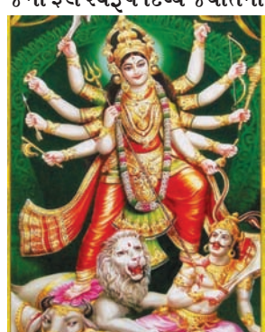
સાક્ષાત દર્શન કરી ખેલેલાઓમાં ગરબે ધુમવાનો આનંદ-ઉત્સાહ