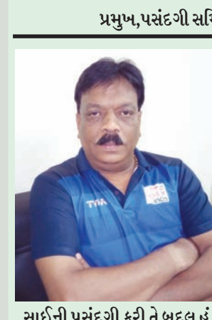
સાર્ઈની પસંદગી કરી તે બદલ હું તેમનો અને હેન્ડબોલ ફેડરેશનનો આભારી છું.’

આ કેમ્પમાં દેશના વિવિધ રાજ્યોમાંથી ખેલાડીઓ આવ્યા છે બાંગ્લાદેશના ઢાકા ખાતે આગામી મહિને આઈએચએફ ટ્રોફી યોજાશે જેમાં એશિયાના ૮ દેશની ટીમો ભાગ લેશે. આ સ્પર્ધામાં વિજેતા ટીમ કોન્ટિનેન્ટલ માટે ક્વોલીફાય થશે અને ત્યાંથી પછી યુથ વર્લ્ડકપ માટે ક્વોલીફાય થવાનું રહેશે. ભારત માટે ઢાકામાં સૌથી મોટો પડકાર પાકિસ્તાનની ટીમને હરાવવાનો છે. હેન્ડબોલની ટીમની પ્રાથમિક પસંદગીમાં છોકરાઓની ટીમ જે અન્ડર-૨૧ કેટેગરીમાં રમવાની છે તેમાં ગાંધીનગરના બે ખેલાડી પસંદગી પામ્યા છે. આ બે ખેલાડીઓ સાર્ઈ ખાતે જ તાલીમ આપી રહ્યાં છે.