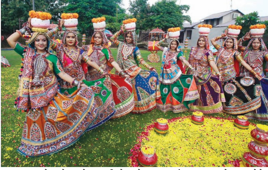
ગુજરાતના ગરબો : ગરબો ગુજરાતની ઓળખ છે. ગુજરાત આખું ગરબા પાછળ અને ગરબા માટે ઘેલુ બને છે. નવરાત્રી મહોત્સવમાં યુવક-યુવતીઓ અવનવા શણગાર સજીને રાતભર ગરબે ઘુમે છે. નવરાત્રીના પાંચ દિવસ પહેલા ગરબા ગૃપો ઠેક-ઠેકાણે રીયસલ કરી રહ્યા છે. અમદાવાદના એક ગરબા ગૃપે યોજાયેલ રીયસલની આ તસવીર નવરાત્રીના આગમનની છડી પોકારે છે.