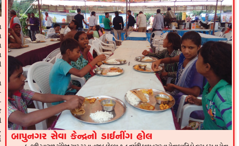
બાપુનગર સેવા કેન્દ્રનો ડાઈનીંગ હોલ ક-૭થી આગળ રાંધેજા ચાર રસ્તા નજીક છેલ્લા ૧૮ વર્ષથી બાપુનગરના સેવાભાવિકો દ્વારા કરાતા સેવા કેન્દ્ર પર સવારે ગરમાગરમ યા-નાસ્તા સાથે બપોરે ચોખ્ખા ઘીના જલેબી-મોહનથાળ સાથે શાક-કઠોળ-ફરસાણ સહિતનું પાકુ ભોજન અને સાંજે રોટલા-કઢી-ખીચડીનું જમણ પીરસાય છે. અહીં તમામ પદયાત્રીઓને ખુરશી ટેબલ પર ડાઈનીંગ હોલની જેમ બેસાડીને પીરસવામાં આવે છે. તથા ૨૪ કલાક ગરમ પાણી સાથે ન્હાવાઘોવાની મહિલા-પુરૂષની અલગ વ્યવસ્થા સાથે ટોયલેટ્સની પણ સુવિધા પુરી પાડવામાં આવી હતી.

જમણ, રહેવા-જમવા, ન્હાવા-ઘોવા ઉપરાંત મેડીકલ સહિતની સેવાઓ ગાંધીનગરે હોંશે હોંશે પુરી પાડતા પદયાત્રીઓ પણ ભાવ વિભોર બન્યા હતા.