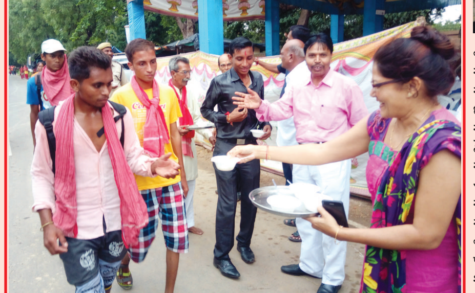
શહેરના વકિલોએ મહાપ્રસાદ ખવડાવ્યો ક-૭ સર્કલથી માણસા તરફના માર્ગે મહાકાળી માતાના મંદિરે શહેરના ધારાશાસ્ત્રીઓ દ્વારા ચોખ્ખા ઘીના ડ્રાયફ્રૂટ સાથેના મહાપ્રસાદની સેવા અવિરત પુરી પાડી રહ્યા છે. આ કેન્દ્ર ખાતે જિલ્લા પંચાયતની આરોગ્ય શાખા દ્વારા સ્વાસ્થ્ય નિયંત્રણ સહિતની તમામ દવાઓ અને પ્રાથમિક સારવારની સુવિધા પુરી પડાઈ રહી છે.

ફૂલવડીનો નાસ્તો, યા વગેરેની ૨૪ કલાક સેવા પુરી પડાઈ હતી. આ સેવાકેન્દ્ર પણ ૧૪ વર્ષથી યોજવામાં આવે છે. વાવોલ ખાતે પણ શાલીન-૪ એપાર્ટમેન્ટ દ્વારા યાત્રિકોને યા-બિસ્કિટ, પીવાનું પાણી વગેરેની સેવા અપાઈ હતી. જ્યારે જય અંબે મિત્રમંડળના છેલ્લા ૧૨ વર્ષથી યોજાતા સેવા કેન્દ્ર ખાતે બુંદી-ગાંઠિયા-પાપડી-પોંઆ-બટાકાવડા સાથે યા-કોફીની સુવિધા કરાઈ હતી. ક-૭ સર્કલ નરોડાથી