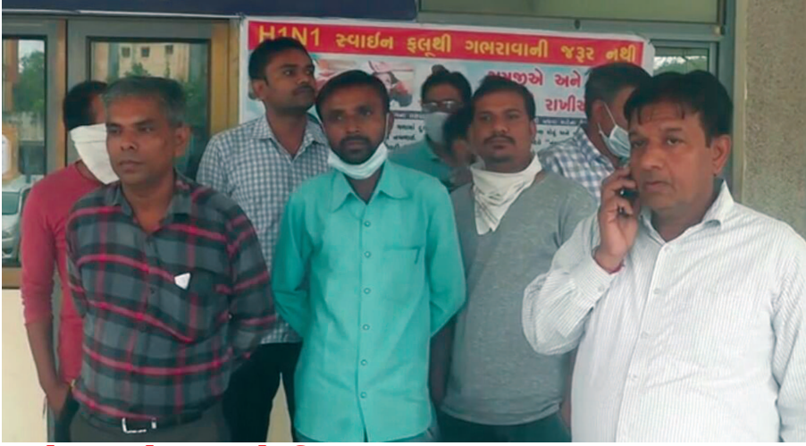
જાહેર આરોગ્ય સાથે મિલવાડ : ધારાસભ્ય

એકબાજુ રાજ્યભરમાં સ્વાઈનફ્લૂનો કહેર વધતો જાય છે. ત્યારે ખુદ રાજ્યના મુખ્યમંત્રી અને રાજ્ય આરોગ્ય મંત્રી ચિંતિત છે. ત્યારે બીજાબાજુ સ્વાઈનફ્લુ જેવા રોગમાં પણ પાલનપુર સિવિલની એક પછી એક ઘોર બેદરકારી સામે આવી રહી છે. જેમાં સિવિલનું રેડિયાળ તંત્ર શંકાસ્પદ સ્વાઈનફ્લુના દર્દીનું સેમ્પલ મોકલવાનું જ ભૂલી જતા દર્દીના સ્વજનોએ હોબાળો મચાવ્યો હોવાની ઘટના સામે આવી છે.