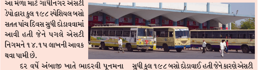
દર વર્ષે અંબાજી ખાતે ભાદરવી પૂનમના મેળામાં લાખો શ્રદ્ધાળુઓ ઉમટી પડે છે. મોટે ભાગે આ મેળામાં પદયાત્રીઓ આવે છે જેઓ અંબાજી સુધી ચાલતા તો જાય છે પરંતુ પરત ફરવા માટે અેશટી બસનો ઉપયોગ કરે છે. વળી, અનેક શ્રદ્ધાળુઓ જે પદયાત્રા કરી નથી શકતા તેઓ મા જગદંબાના દર્શન કરવા એસટી બસ દ્વારા અંબાજી જાય છે. ગુજરાતના સુધી કુલ ૧૯૮ બસો દોડાવાઈ હતી જેને કારણે એસટી ડેપોને ૧૪.૧૫ લાખની આવક થવા પામી છે. અંબાજીનો મેળો સાત દિવસ સુધી ચાલે છે અને ભાદરવી પૂનમે પૂર્ણ થાય છે. આ વર્ષે આ મેળામાં ૨૭ લાખ જેટલા શ્રદ્ધાળુઓએ આ અંબાજી દર્શન કર્યા હતા. આ સંજોગોમાં ગાંધીનગર એસટી ડેપોએ મુશ્કેલોને સુવિધા પુરી પાડવા સાથે આવક પણ ઉભી કરી છે.

ગાંધીનગર, તા.૯ ભાદરવી પૂનમે અંબાજી ખાતે ભરાતો વિશ્વનો સૌથી મોટો પદયાત્રી મેળો નિર્વિઘ્ને સંપન્ન થયો છે. આ વર્ષે ગાંધીનગર એસટી ડેપો દ્વારા કુલ ૧૯૮ સ્પેશિયલ બસો સતત પાંચ દિવસ સુધી દોડાવવામાં આવી હતી જેને પગલે એસટી નિગમને ૧૪.૧૫ લાખની આવક થવા પામી છે.