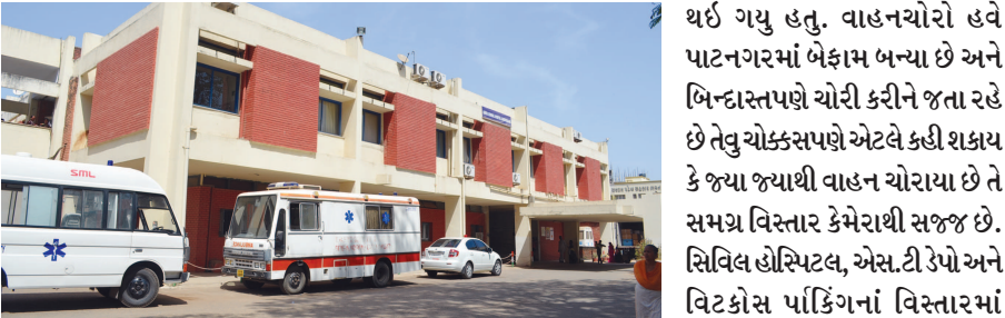
મેડીકલ કોલેજમાં અભ્યાસ કરતા અને મેડીકલ કોલેજની હોસ્ટેલમાં રહેતા મુળ તમિલનાડુનાં વિદ્યાર્થીનું દોઢ લાખની કિંમતનું ક્રેડીટકાર્ડ બાઈક શહેરની સિવિલ હોસ્પિટલનાં પાર્કિંગમાંથી ગુરુવારે બપોરનાં અરસામાં ચોરી થઈ જવા પામ્યું હતું. ટી.એન.૭ એફ ૭૪૬૧