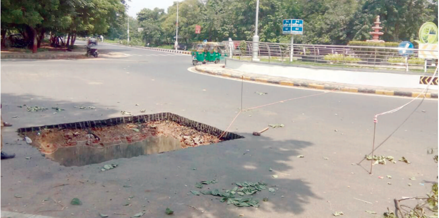
નગરના ગ માર્ગ પર મોટામસ ગાબડાને લીધે ભયજનક સ્થિતિ સર્જાઈ છે. શહેરમાં વરસાદી દિવસોના અંતે ગટર લાઈનમાં ભંગાણ થતા મોટા ગાબડા અસ્તિત્વમાં આવ્યા હોવાની પણ વ્યાપક ફરિયાદો ઉઠવા પામી હતી. જ્યારે શહેરના માર્ગો વચાળે પણ ભયજનક ખાડા માર્ગ સલામતીની દ્રષ્ટીએ જોખમી બન્યા છે. નગરના ગ માર્ગ પર સે-૧૨ ની ચોકડી પાસે માર્ગ વચાળે જ મોટું મસ ગાબડું જોવા મળી રહ્યું છે. ત્વરિત ગાબડું પુરવા કામગીરી હાથ ધરવામાં નહીં આવે તો જાનલેવા અકસ્માત થવાની દહેશત છે.

ગાંધીનગર, તા.૯ મુખ્યમંત્રી વિજયભાઈ રૂપાણીએ ભારતને જગદગુરુ બનાવવાની પ્રધાનમંત્રી નરેન્દ્રભાઈની સંકલ્પ બદ્ધતામાં ટ્રાન્સપોર્ટેશન-લોજિસ્ટીક સેક્ટર અગ્રણી રહી શકે તેમ છે, તેવો વિશ્વાસ વ્યક્ત કર્યો છે. આ સંદર્ભમાં તેમણે કહ્યું કે, બદલાતા વિશ્વ સાથે જ્યારે હવે ટ્રક-ટ્રેલર-ટાયર શેઝે નવા નવા અવિસ્કારો થઈ રહ્યા છે. તેનો દેશ-રાજ્યમાં વ્યાપક વિનિયોગ હવે સમયની માંગ બન્યો છે. મુખ્યમંત્રીએ મહાત્મા મંદિરમાં યોજાઈ રહેલા ટ્રક-ટ્રેલર-એન્ડ ટાયર અને રાજ્યના જી.ડી.પી.માં મોટો ફાળો થયો છે. સમયબદ્ધ-સુરક્ષિત અને સલામત ટ્રાન્સપોર્ટ હવે સમયની માંગ છે તેમ જણાવતાં મુખ્યમંત્રીએ કહ્યું કે, કેન્દ્રની વર્તમાન નરેન્દ્રભાઈ મોદીની આ સરકાર રસ્તાને ગતિ-પ્રગતિના સંવાહક તરીકે સ્વીકારીને ઈન્ફ્રાસ્ટ્રક્ચર ડેવલપમેન્ટ સાથે એક્સપ્રેસ-વે સીક્સલેન-વેના નવતર અભિગમથી કાર્યરત છે. આવા સમયે ગુજરાતમાં યોજાઈ રહેલા આ પ્રદર્શનને તેમણે રાઈટ ટાઈમ ફોર રાઈટ જોબ ગણાવીને આયોજકોને અભિનંદન પાઠવ્યા હતા.