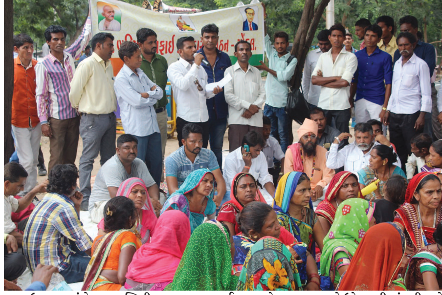
ઉપવાસ આંદોલન : વાલ્મિકી સમાજ દ્વારા સફાઈ કામદારોના પડતર પ્રશ્નો ઉકેલવાની માંગણી સાથે પાટનગરમાં ઉપવાસ આંદોલન આરંભાયું છે.

ગાંધીનગર, તા. ૧૧ ગુજરાત વિધાનસભાની ચૂંટણીઓને લઈ કોંગ્રેસ પક્ષ દ્વારા મહત્વની સ્કીનીંગ કમીટીની પ્રથમ બેઠક આજે અમદાવાદમાં મળી હતી. કમીટીના ચેરમેન બાલાસાહેબ થોરાટના અધ્યક્ષ સ્થાને મળેલી બેઠકમાં ગુજરાત કોંગ્રેસના નેતાઓ સહિતના આગેવાનો સાથે ઉમેદવારો, પસંદગીના ધારાધોરણો સહિતના મુદ્દાઓ પર મહત્વની ચર્ચા વિચારણા હાથ ધરવામાં આવી હતી. વિધાનસભાની ચૂંટણીઓને લઈ કોંગ્રેસના ઉમેદવારોની પસંદગીની સત્તાવાર પ્રક્રિયાની શરૂઆત થઈ ગઈ હતી. જેમાં શહેરી વિસ્તારના કોંગ્રેસના ઉમેદવારોની જલ્દી પસંદગી થાય તેવી શક્યતા સેવાઈ રહી છે ત્યારબાદ ગ્રામ્ય વિસ્તારનો તબક્કો હાથ પર લેવાશે. સ્કીનીંગ કમીટીના નેતાઓની બેઠકોનો દોર આવતીકાલે પણ પ્રદેશ કોંગ્રેસ ઈલેક્શન કમીટીના હોદ્દાદારો સાથે જારી રહેશે. મહારાષ્ટ્રના સાંસદ બાલાસાહેબ થોરાટના આગેવાનો સાથે ઉમેદવારો, પસંદગીના ધારાધોરણો સહિતના સ્કીનીંગ કમીટીએ આજે ગુજરાત કોંગ્રેસના નેતાઓ અને પ્રદેશ કોંગ્રેસ ઈલેક્શન કમીટીના હોદ્દાદારો સાથે બેઠકોનો દોર યોજાયો હતો. જેમાં પ્રદેશ કોંગ્રેસ પ્રમુખ ભરતસિંહ સોલંકી સહિતના સ્થાનિક નેતાઓ અને આગેવાનો હાજર રહ્યા હતા.