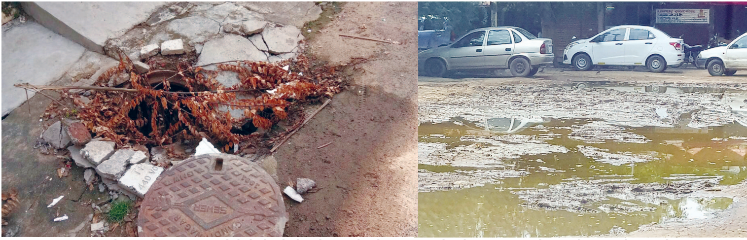
ગાંધીનગર, ગટર અને ગંદકી એક જ રાશીમાં આવે છે એટલે ત્રણેયને સારો સંબંધ હોય એવું અનુભવાય છે. શહેરમાં ગટરના પ્રશ્નો ઇલાશવારે ઉભરાય છે. ગંદકી તો ગાંધીનગરની સગી બહેનપણી થાય એમ સતત સાથેને સાથે રહે છે. ગંદકી અને ગટરના પ્રશ્નો પ્રમાણિક રીતે ઉકેલાય તો ગાંધીનગર સાચા અર્થમાં સ્માર્ટ સિટી બની જાય.