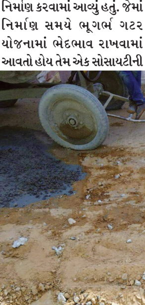
નિર્માણ કરવામાં આવ્યું હતું. જેમાં નિર્માણ સમયે ભૂગર્ભ ગટર યોજનામાં ભેદભાવ રાખવામાં આવતો હોય તેમ એક સોસાયટીની

તોડ્યા બાદ કોન્ટ્રાક્ટર દ્વારા રોડનું સમારકામ બરાબર ન થતા આર.સી.સી.રોડ પરથી કપચી અને રેતી ઉખડી જતા અને બનાવેલ