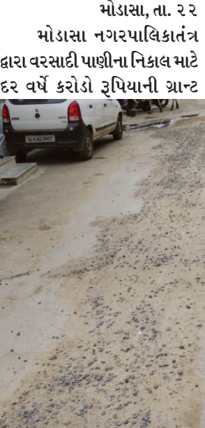
મોડાસા, તા. ૨૨ મોડાસા નગરપાલિકા તંત્ર દ્વારા વરસાદી પાણીના નિકાલ માટે દર વર્ષે કરોડો રૂપિયાની ગ્રાન્ટ