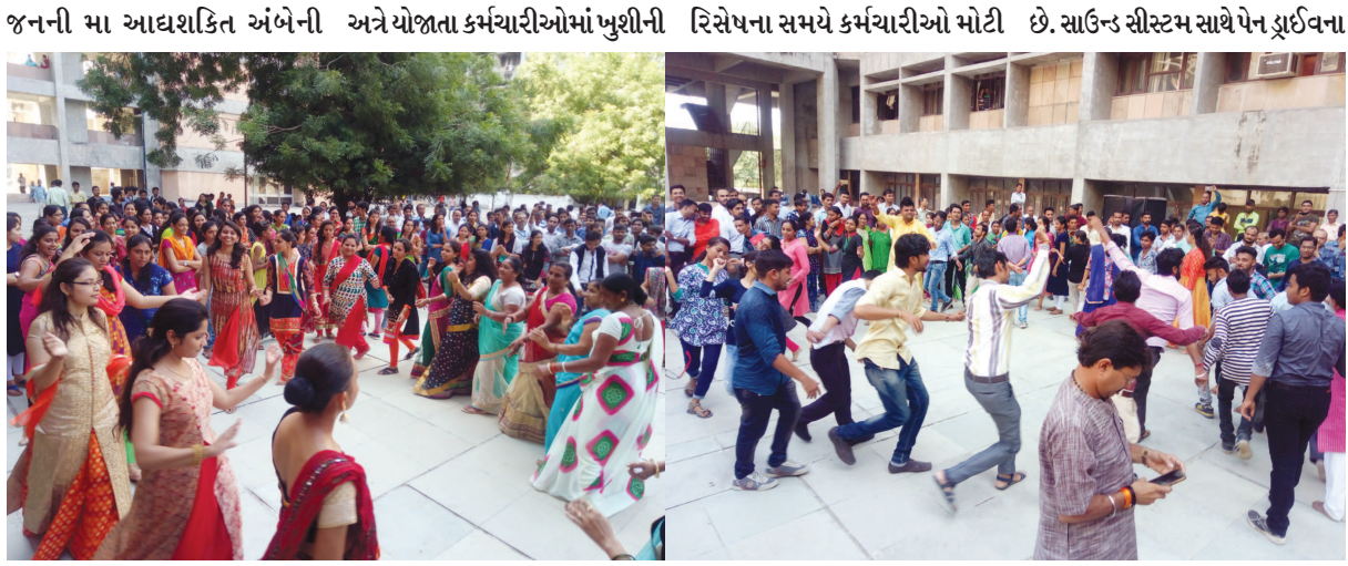
જનની મા આદ્યશક્તિ અંબેની અને યોજાતા કર્મચારીઓમાં ખુશીની રિસેપના સમયે કર્મચારીઓ મોટી છે. સાઉન્ડ સીસ્ટમ સાથે પેન ડ્રાઈવના આરાધના સમા ગરબા ફરી એકવાર લહેર વ્યાપી છે. અને બપોરની સંખ્યામાં ગરબા રમવા જોડાઈ રહ્યા સહારે ગરબાનું સંગીત રેલાવી

ગાંધીનગર, તા.૨૬ ઓઠણી ઓઠુ ઓઠુને ઉડી જાય... કાચી કેરી ને અંગુર કાલા... અમે ગુજરાતી લહેરી લાલા... ગાંધીનગરના નવા સચિવાલયના કર્મચારીઓ ત્રણેક વર્ષ પછી ફરી એકવાર સચિવાલય સંકુલમાં મન મુકીને ગરબે ઘુમ્યા હતા. અગાઉ દર વર્ષે નવરાત્રિમાં નિયમિત પણે રિસેપના સમય દરમિયાન કર્મચારીઓ માટે ગરબાનું આયોજન થતું હતું જે કોઈ કારણોસર છેલ્લા ત્રણેક વર્ષથી અટકી પડ્યું હતું. આ વર્ષે ફરી એકવાર નવા સચિવાલય સંકુલમાં ગરબા યોજાતા કર્મચારીઓમાં ખુશીની લહેર વ્યાપી