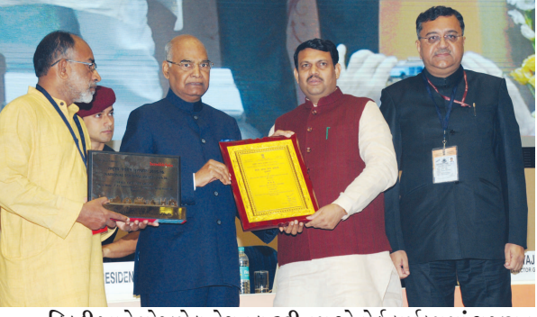
દિલ્હી ખાતે યોજાયેલ નેશનલ ટુરીઝમ એવોર્ડ કાર્યક્રમમાં ગુજરાત ટુરીઝમને 'હોલ ઓફ ફેમ' નેશનલ એવોર્ડ પ્રાપ્ત થયો છે. રાષ્ટ્રપતિ રામનાથ કોવિંદના હસ્તે પર્યટનમંત્રી ગણપતસિંહ વસાવાએ આ એવોર્ડ સ્વીકાર્યો હતો. પ્રવાસન સચિવ એસ.જે. હેંદર પણ આ અવસરે જોડાયા હતા.